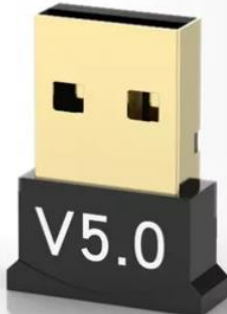
Adaptador Bluetooth externo USB 5.0

Tornar os computadores habilitados para Bluetooth