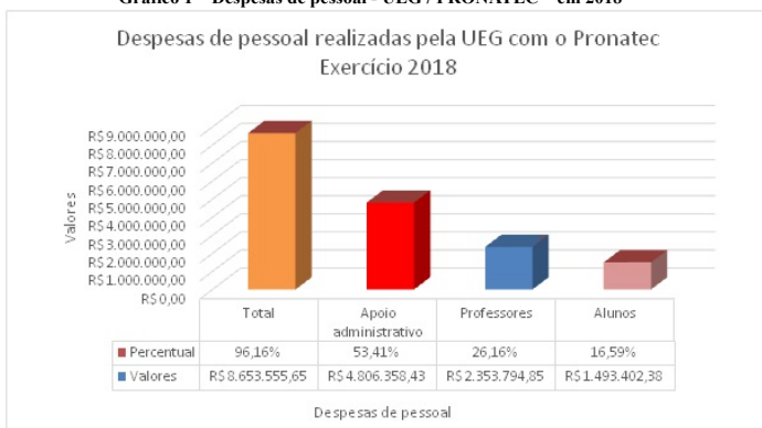
Gráfico 1 – Despesas de pessoal - UEG / PRONATEC – em 2018