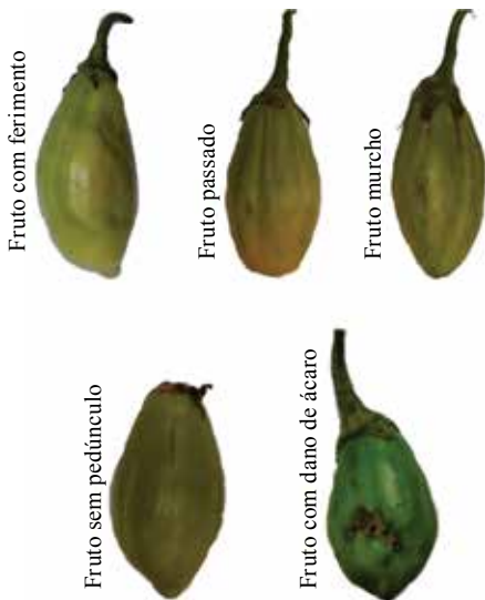
Figura 18. Classificação de frutos.