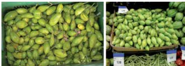
Figura 16. Comercialização de frutos (caixas).