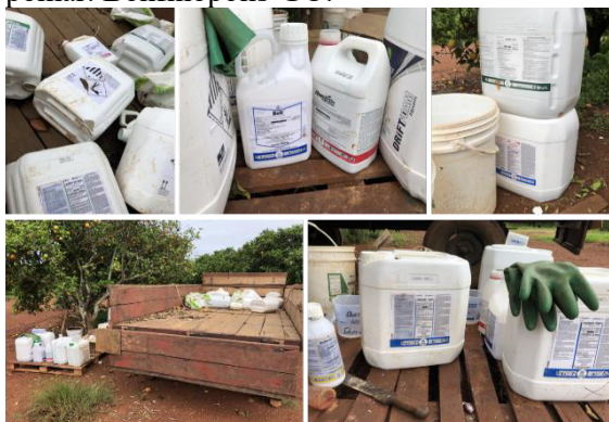
Imagem 3: Alguns agroquímicos utilizados no pomar. Bonfinópolis-GO.

que é um processo químico-biológico de formação de nitrito, a depender dos níveis de concentração pode ser tóxico, no solo pela ação conjunta de bactérias quimiossintetizantes nitrificantes, pela ação de conversão da amônia em nitrato, que faz parte de grande parte dos fertilizantes químicos (principalmente os nitrogenados) além dos potenciais poluidores da presença de metais pesados em sua composição.