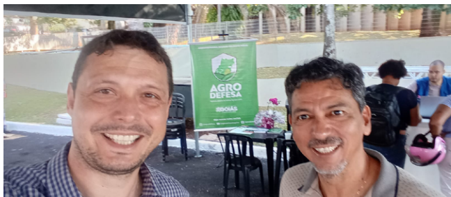
Agrodefesa no programa Goiás Social em Jataí