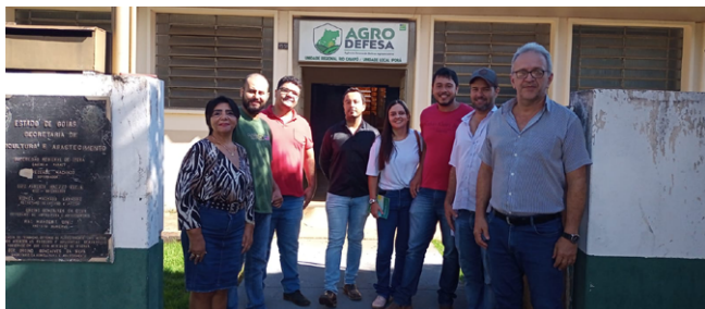
Reunião sobre instalação do SIM em Iporá