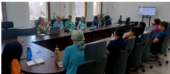
Reunião do Fórum Goiano de Combate aos Impactos dos Agrotóxicos