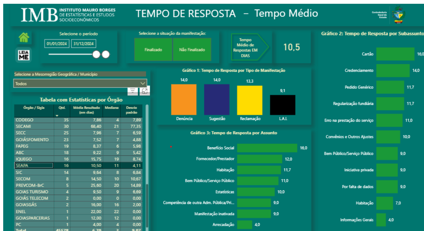
Figura-6: Tempo de Resposta – Tempo médio