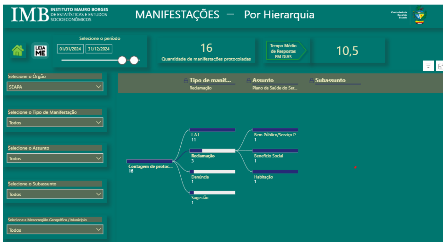
Figura-3: Manifestações – Por Hierarquia