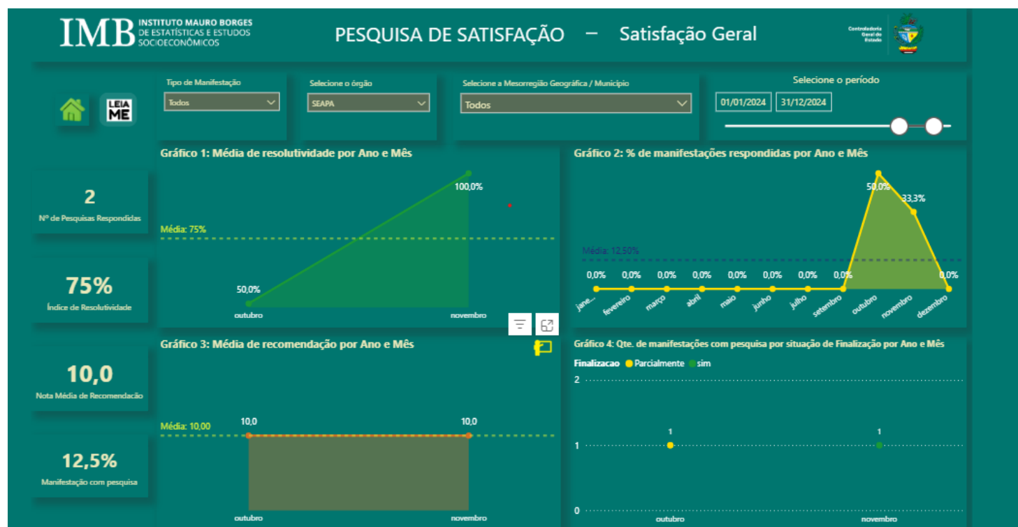
Figura-5: Pesquisa de Satisfação – Satisfação Geral