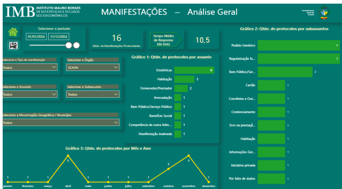
Figura-1: Manifestações Recebidas – Análise Geral