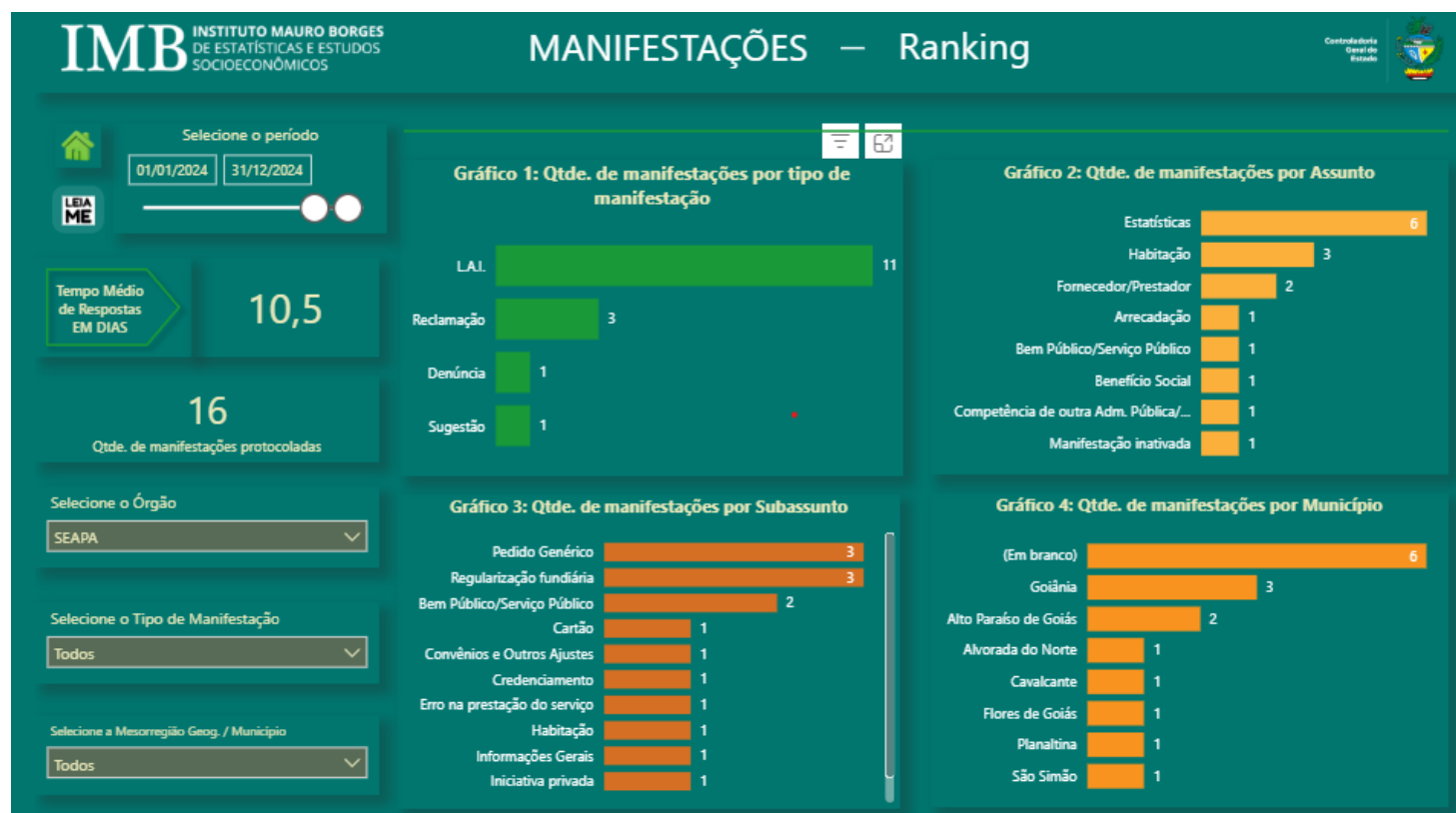
Figura-4: Manifestações – Ranking