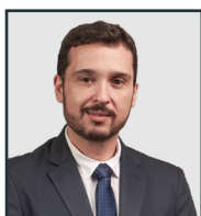
PEDRO LEONARDO REZENDE, SECRETÁRIO DE ESTADO DE AGRICULTURA, PECUÁRIA E ABASTECIMENTO

Neste mês, comemoramos 7 anos da Seapa! A retomada da pasta marcou uma decisão estratégica do Governo de Goiás: fortalecer a governança do agro, dar mais agilidade às políticas públicas e alinhar a atuação estatal às demandas reais do setor produtivo e da sociedade. Desde então, a Seapa atua de forma participativa e descentralizada, em diálogo permanente com entidades públicas e privadas ligadas direta ou indiretamente ao meio rural.