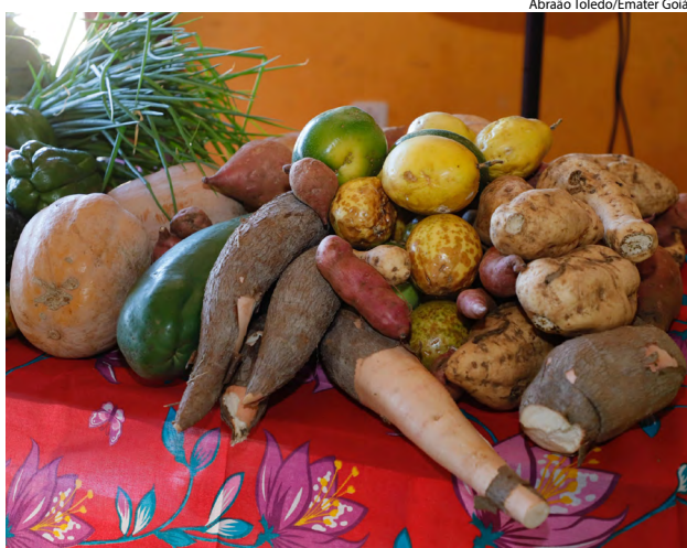
Abraão Toledo/Emater Goiás

O Governo de Goiás, por meio da Seapa, em parceria com a Emater Goiás, publicou novo edital para o PAA Quilombola. A iniciativa integra o leque de ações do Goiás Social, contribuindo para impulsionar o agro goiano, com foco na inclusão produtiva e no desenvolvimento da