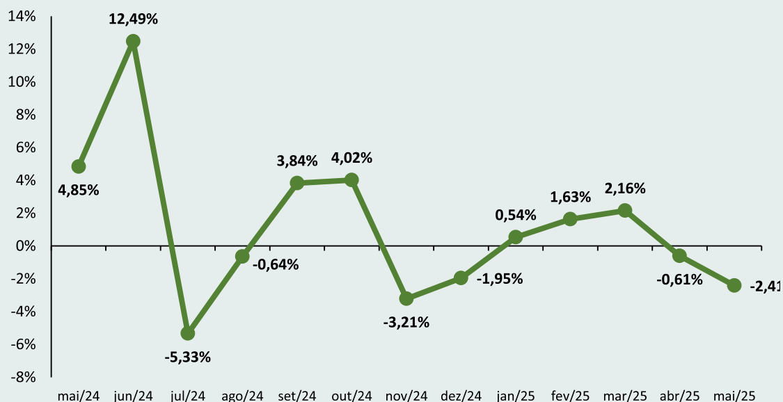
Figura 1 – Variação mensal do índice de preços da cesta de derivados lácteos nos últimos 12 meses.

Fonte: MilkPoint Mercado. Elaboração: Instituto Mauro Borges de Estatística e Estudos Socioeconômicos (IMB).