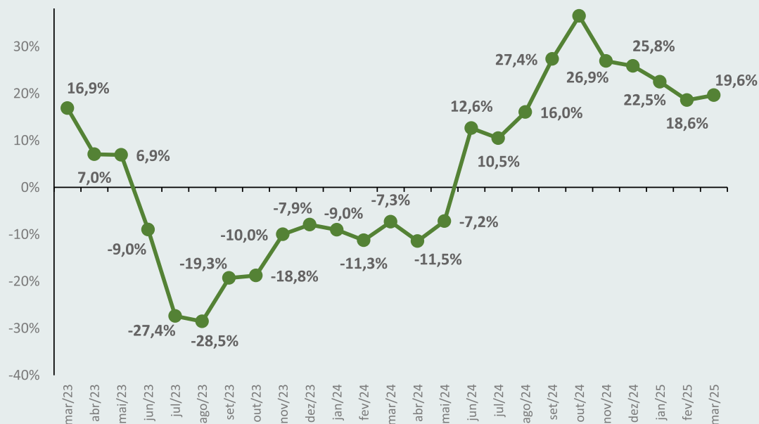
Figura 2 – Variação mensal do índice de preços da cesta de derivados lácteos acumulado nos últimos 12 meses.

Fonte: MilkPoint Mercado. Elaboração: Instituto Mauro Borges (IMB).