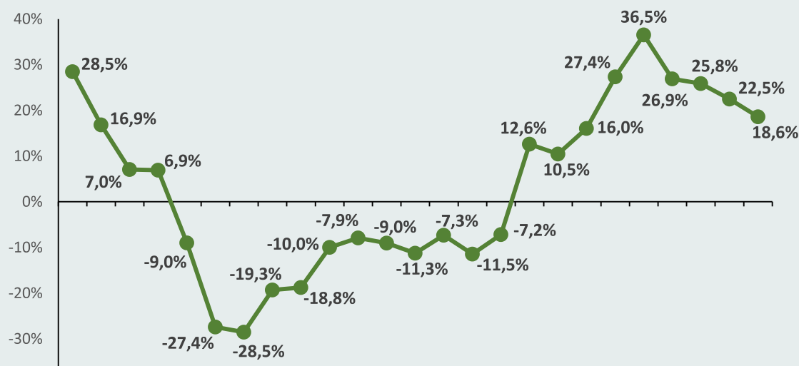
Figura 2 – Variação mensal do índice de preços da cesta de derivados lácteos acumulado nos últimos 12 meses.