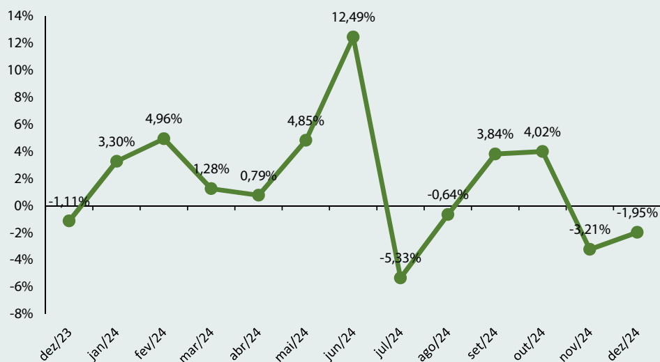
Figura 1 – Variação mensal do índice de preços da cesta de derivados lácteos nos últimos 12 meses.