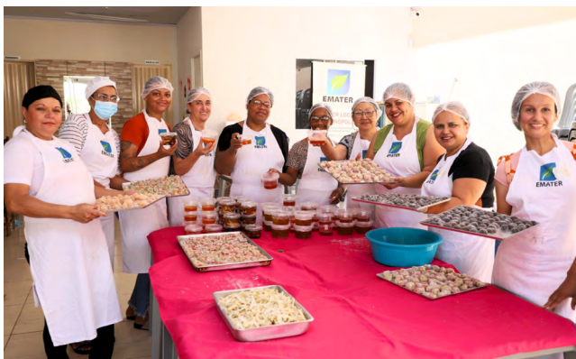
Encerramento da 9ª edição será realizado no dia 11 de dezembro, no Centro de Convenções de Anápolis

A 9ª edição do Agro é Social capacitou 54 turmas com cursos de mais de 16 temáticas em 22 municípios da regional Rio das Antas. São beneficiadas pelo programa as seguintes cidades: Anápolis, Hidrolândia, Bonfinópolis, Abadiânia, Bela Vista, Caldasinha, Caturai, Damolândia, Goianópolis, Goianira, Inhumas, Itauçu, Jesópolis, Leopoldo de Bulhões, Nerópolis, Nova Veneza, Ouro