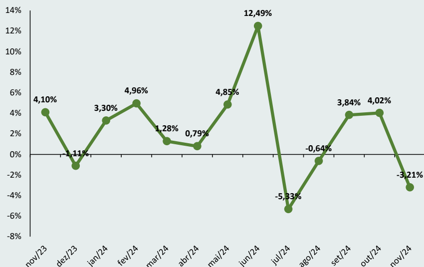
Figura 1 – Variação mensal do índice de preços da cesta de derivados lácteos nos últimos 12 meses.

Fonte: MilkPoint Mercado. Elaboração: Instituto Mauro Borges (IMB).