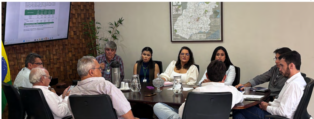
Em reunião, a Câmara também debateu os desdobramentos das ações desenvolvidas pela Secretaria de Estado da Economia com foco no setor lácteo goiano