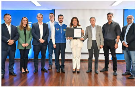
EVENTO CRÉDITO SOCIAL EM AÇÃO, DO GOVERNO DE GOIÁS, FOI REALIZADO EM PARCERIA COM O SEBRAE E O SENAI