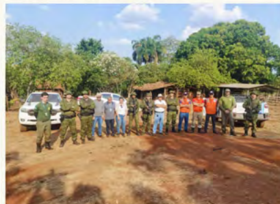
Durante a operação foram realizadas intervenções para identificar e desativar pontos irregulares de captação de água nos aquíferos que abastecem a cidade, com fiscalizações e desativações conduzidas após orientações da Semad e Saneago

Na última terça-feira (02/10), a Secretaria de Agricultura, Pecuária e Abastecimento (Seapa) participou, em conjunto com diversos órgãos, da Operação Iporá, realizada pela Delegacia de Polícia do município com o objetivo de enfrentar e solucionar a crise de abastecimento de água que afeta a cidade. O ponto de encontro foi na Carteira de Água da Saneago, onde as equipes se reuniram para iniciar as atividades do dia.