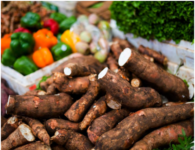
Programa garante fortalecimento da segurança alimentar à população vulnerável

O secretário de Estado de Agricultura, Pecuária e Abastecimento, Pedro Leonardo Rezende, destaca a importância do resultado obtido pelo programa. “O PAA Goiás é um exemplo de política pública que alia o desenvolvimento econômico com a inclusão social e o fortalecimento da segurança alimentar. Através do programa, é possível gerar renda ao produtor de agricultura familiar, e, ao mesmo, contribuir para a segurança alimentar da população em vulnerabilidade social”, explica.