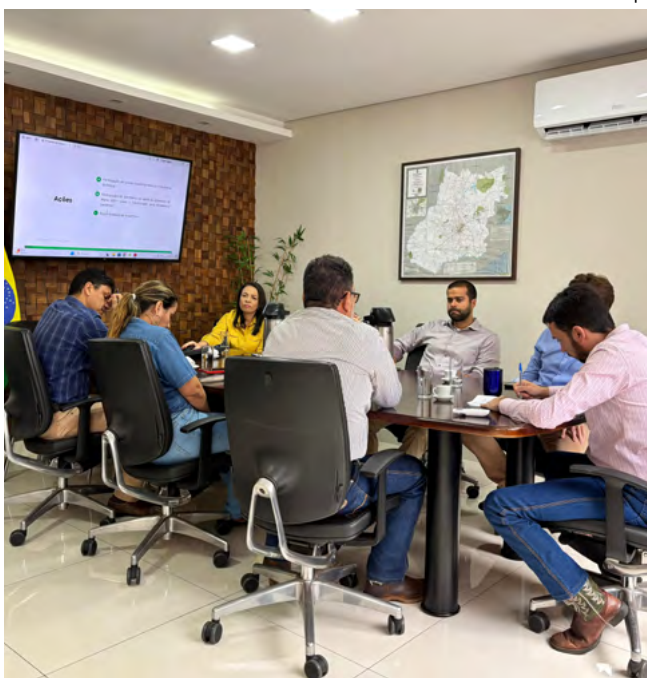
Reunião com representantes pautou principais orientações para implantação segura e eficaz do Plano

Através dessas ações, o programa tem como finalidade contribuir para que o planejamento e a implantação do plano alcancem seus objetivos de forma eficiente, eficaz e econômica, com o intuito de gerar valor público. Ele propicia, ainda, a disposição