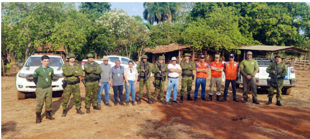
Equipe contou com representantes da Defesa Civil, MP, Semad, Seapa, Prefeitura de Iporá, Saneago, Polícia Civil e Polícia Militar