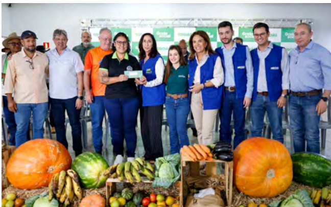
Do campo para a mesa de quem precisa: Governo de Goiás vai comprar 3 mil toneladas de alimentos da agricultura familiar para doar a famílias em situação de vulnerabilidade