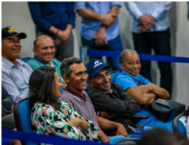
Entrega de escrituras desta quinta-feira foi a maior até agora

A presidente da Agência Nacional de Águas e Saneamento Básico, Veronica Sánchez, afirmou que a outorga é “um elemento essencial” para aumentar a produtividade agrícola com responsabilidade. Ela anunciou, durante o evento, outras cinco outorgas preventivas que vão beneficiar mais 200 pessoas no Nordeste Goiano. Em sua pri-