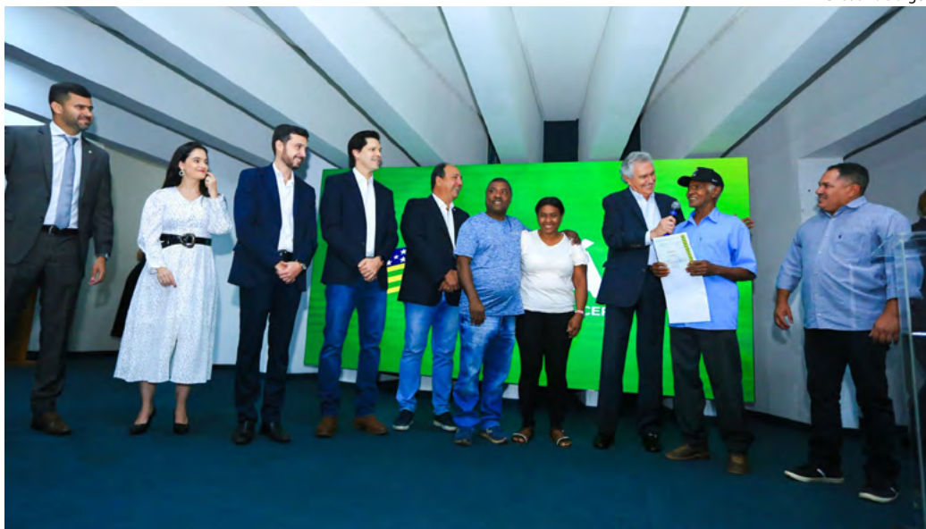
Governador Ronaldo Caiado entrega títulos de terras e outorgas de água para famílias do Nordeste Goiano: “Região esquecida por anos e que agora estamos desenvolvendo”