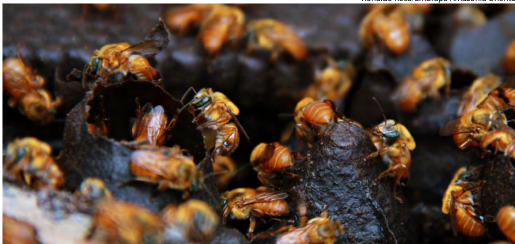
Cadastro contribui, ainda, para garantir a prevenção, o controle e a erradicação de doenças nos sistemas de produção de abelhas