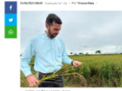
Com a Seapa, Jataí é um dos principais motores do agronegócio goiano

Em entrevista ao portal de notícias, o secretário afirma que Jataí é um dos principais motores do agronegócio goiano