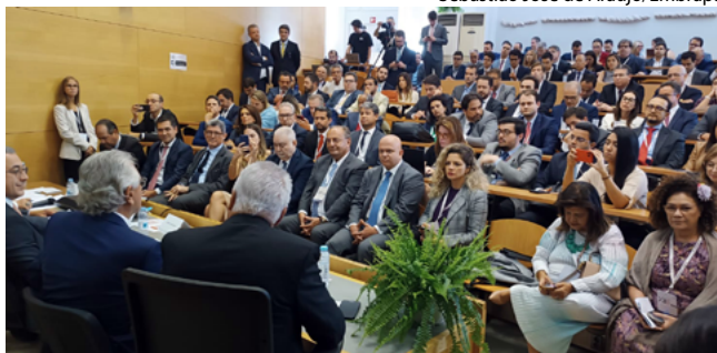
Sebastião José de Araújo/Embrapa

O governador ainda afirmou que um dos entraves para ampliar as exportações brasileiras são as al-