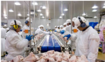
Um Superintendente faz inspeção a produção de frangos em uma indústria em Goiás.

O Estado de Goiás atingiu sua quarta maior produção de frango em 2023, com 1,4 bilhão de toneladas, segundo dados do IBGE divulgados em seu relatório de produção agropecuária. O crescimento de 14,1% em relação ao ano anterior é devido ao aumento da produção de frango de corte, que representa 99,9% do total produzido no Estado.