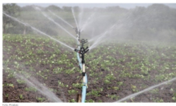
Projeto de Fruticultura Irrigada do Vão do Paranaíba, criado e operacionalizado pela Secretaria de Estado de Agricultura, Pecuária e Abastecimento (SEAPA), está passando por um aprimoramento significativo com a instalação de estações meteorológicas e o desenvolvimento de um aplicativo específico para os produtores participantes. A iniciativa, conduzida pela Companhia de Desenvolvimento dos Vales do São Francisco e do Parnaíba (Codevaf) e pelo Empreza Cerrados, visa otimizar o manejo das culturas de frutas e maneiras na região. As informações foram divulgadas pela Secretaria de Agricultura, Pecuária e Abastecimento (SEAPA) do Governo de Goiás.

Estações meteorológicas vão otimizar desempenho do Projeto de Fruticultura Irrigada