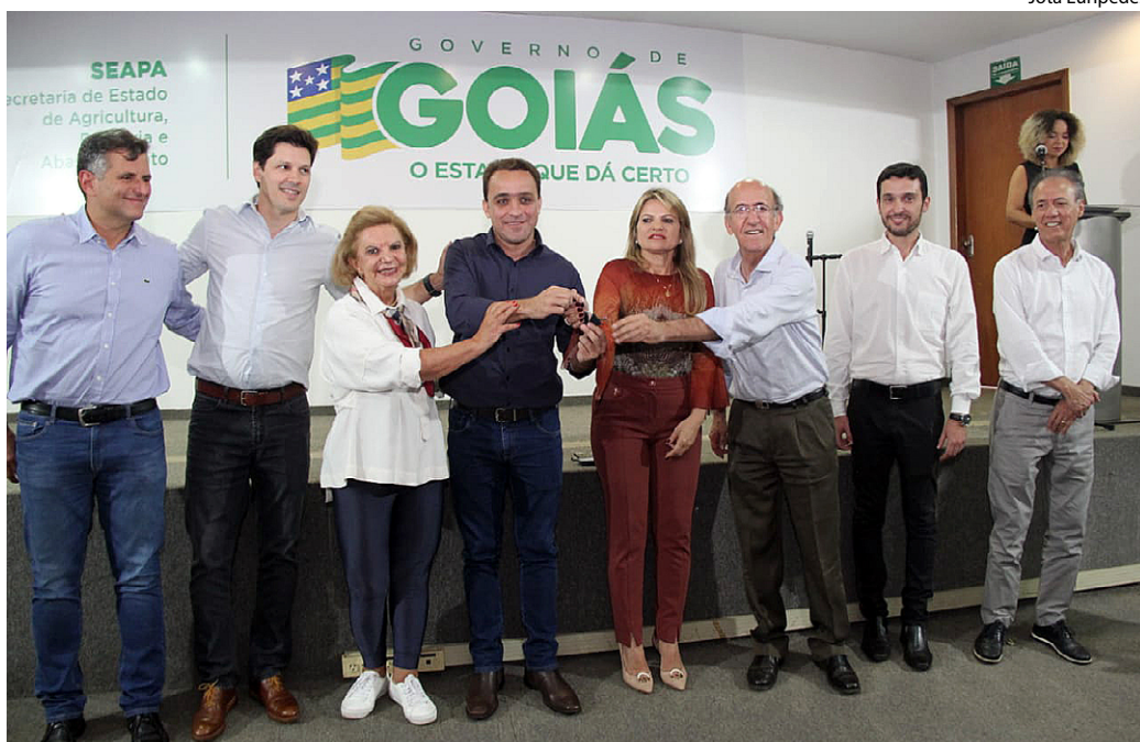
Entrega simbólica dos 223 maquinários e implementos agrícolas aos 57 municípios goianos