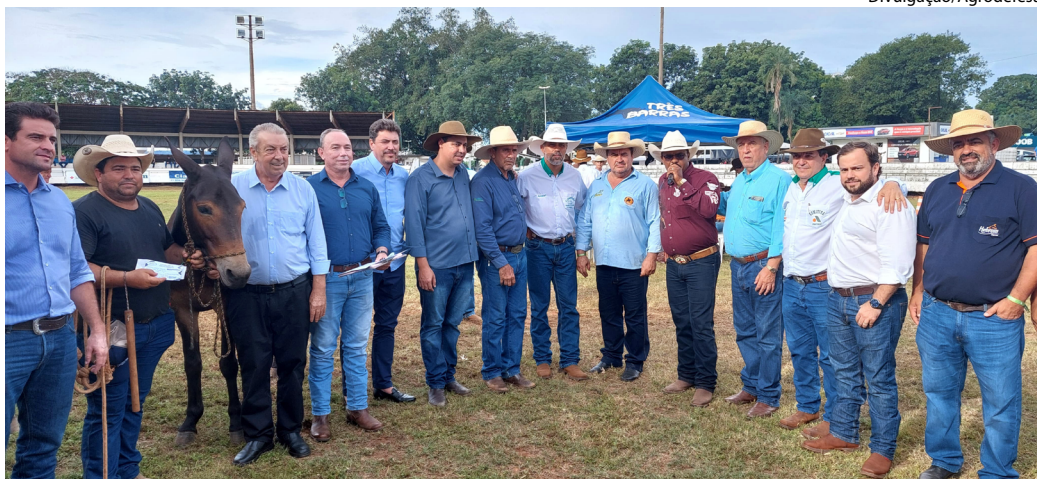
Protocolo foi assinado durante o 1º Encontro de Comitivas, realizado em Goiânia na última semana