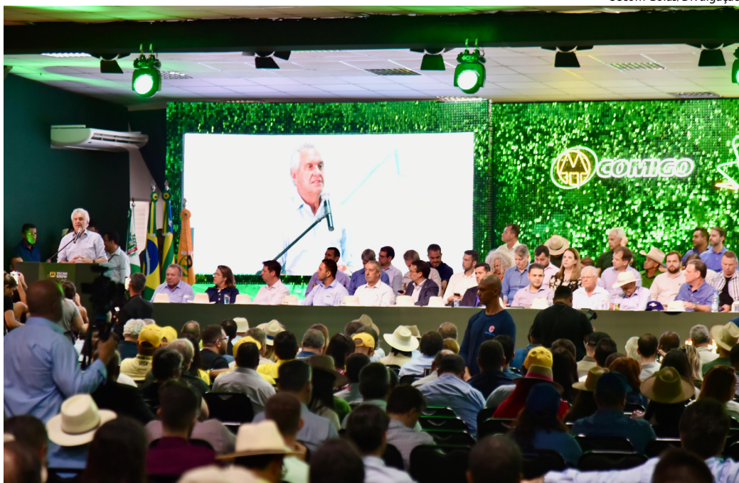
Governo de Goiás marcou presença apresentando oportunidades de negócios e serviços para o produtor rural