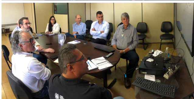
Representantes de entidades que participam da Câmara Técnica e de Conciliação da Cadeia Láctea de Goiás se reuniram com gestores da Seapa