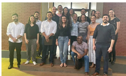
Diretoria da Agrodefesa e gestores da Seapa visitaram estrutura de laboratórios públicos de defesa animal e vegetal

Ele reforça que a meta é investir cada vez mais para oferecer melhores condições de trabalho e alcançar mais resultados no Estado. Para isso, a atual diretoria da Agrodefesa está em busca de recursos para a construção de um novo bloco, onde funcionarão as três unidades, na sede da Agência. “Temos espaço disponível, então vamos trabalhar para nos próximos anos termos os três laboratórios funcionando juntos e com tecnologia de ponta”, ressalta.