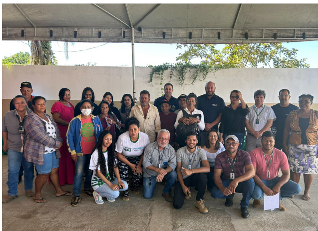
Reunião com agricultores familiares e o prefeito de Flores de Goiás, Altran Avelar

“Estamos fazendo uma grande mobilização para levar orientações e estimular o maior número possível de cadastros ao PAA Goiás. To-