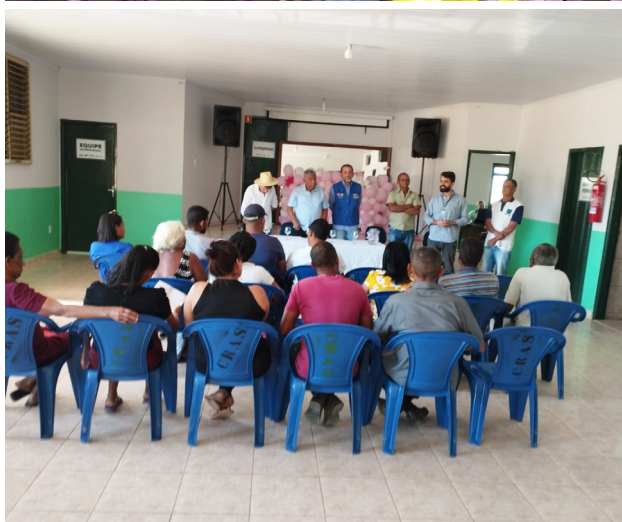
Equipe da força-tarefa em São João D'Aliança, São Gabriel e Nova Roma para tirar dúvidas sobre PAA Goiás