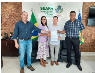
Marzagão - Prefeito Solimar Cardoso e vice-prefeita Edivânia Martins