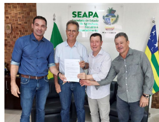
Barro Alto Prefeito Álvaro Machado