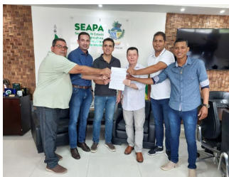
Posse Prefeito Helder Bonfim