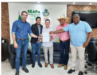
Divinópolis Prefeito Charley Tolentino