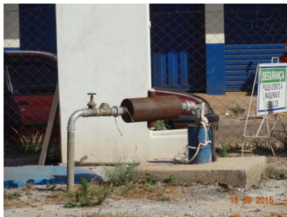
Foto 3 - Poço da ETA