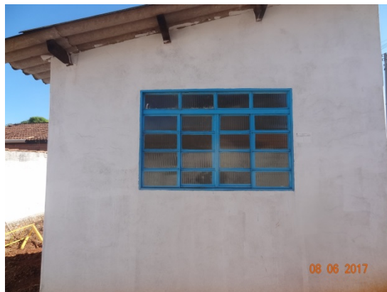
Foto 11- Casa de bombas do Booster Jardim Floresta com janelas recuperadas