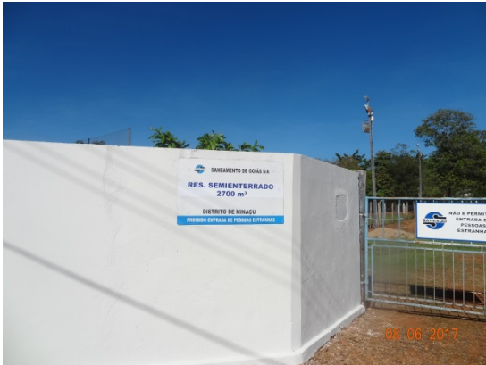
Foto 5 – Portão de entrada RSE 2700m 3