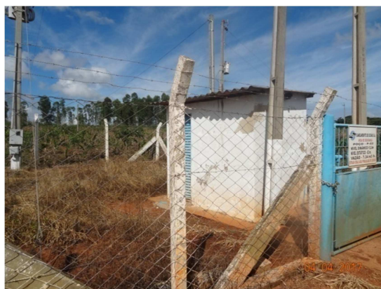
Foto 4 – Área do poço P-02 - instalações com pintura desgastada. Área com mato alto.