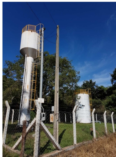
Foto 2 - Reservatórios de 15 e 50 m 3 com guarda-corpos instalados..