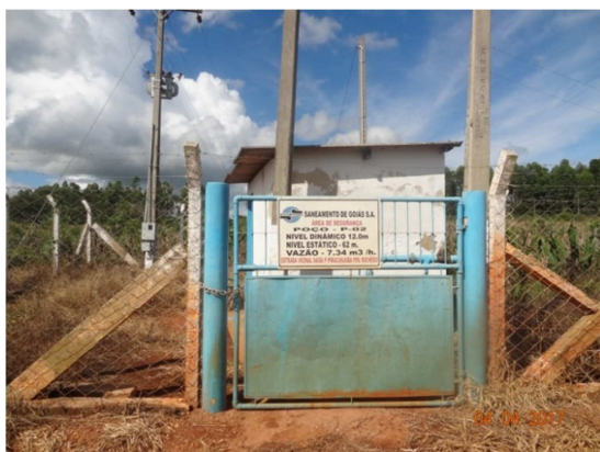
Foto 3 – Área do poço P-02 - instalações com pintura desgastada. Área com mato alto.