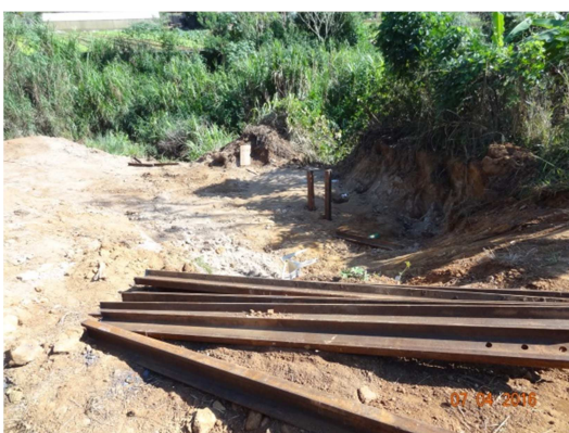
Foto 31: Travessia para interligação do sistema produtor Alto paraíso (junho)