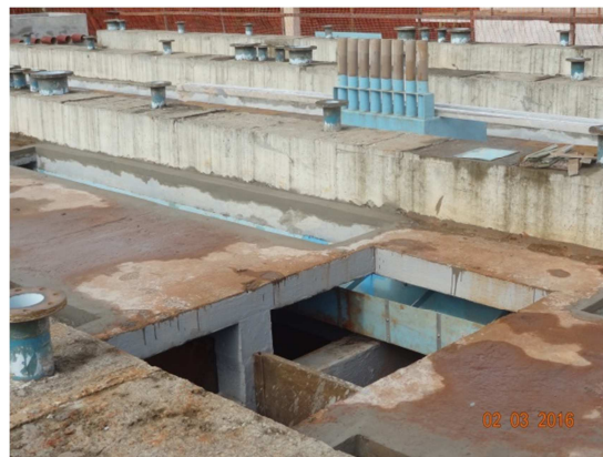
Foto 2 – Montagem das estruturas internas dos reatores – ETE Santo Antônio (março)