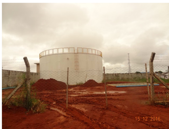
Foto 36: CR Park Sul (dezembro)