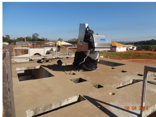
Foto 4 – Equipamentos do tratamento preliminar ETE Santo Antônio (abril)