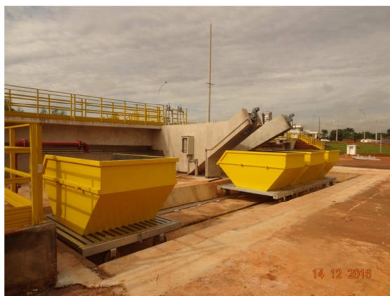
Foto 18: Caçambas para depósito de resíduos gradeados ETE Santo Antônio (dezembro)