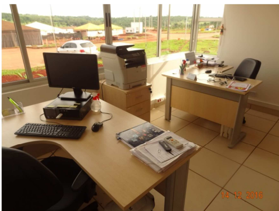
Foto 17: Sala de controle operacional ETE Santo Antônio (dezembro)