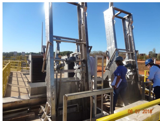
Foto 8 – Equipamentos do tratamento preliminar na ETE Santo Antônio (junho)