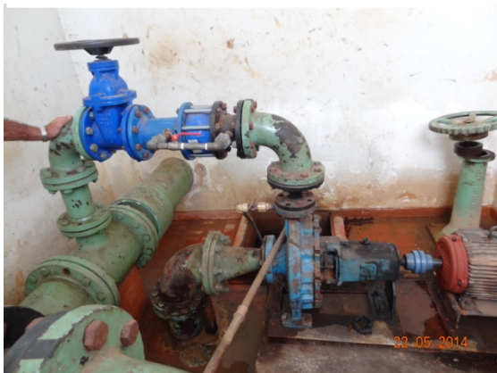
Foto 03 - Vazamento solucionado