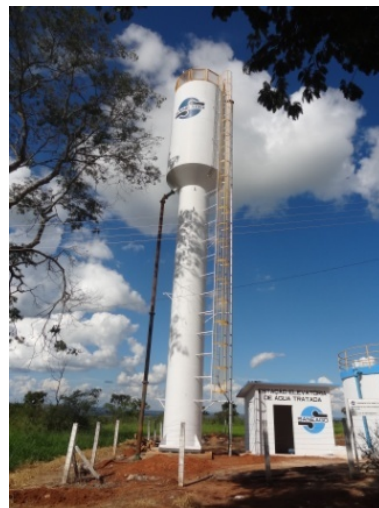
Foto 04 – Reservatório Elevado tipo metálico com pintura nova e guarda-corpo instalado