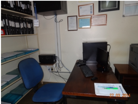
Foto 1- Escritório informatizado.