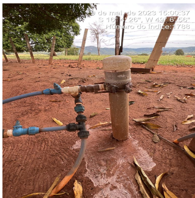
Foto 4 - Poço com tratamento na saída, cloração da água realizado com pastilhas de cloro.