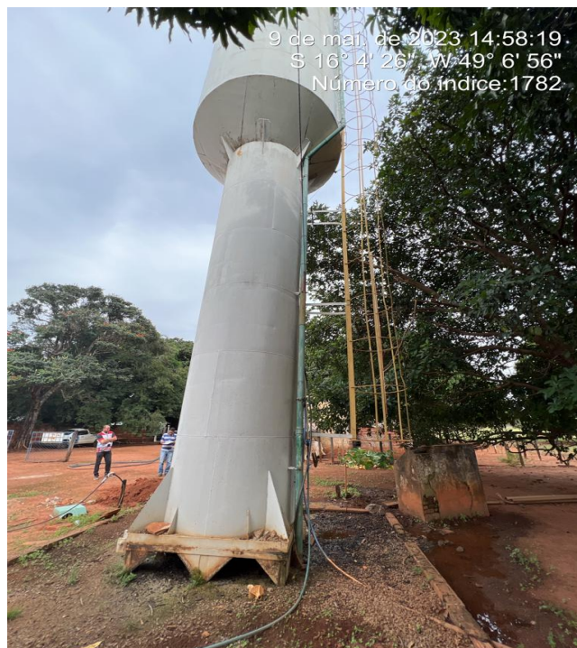
Foto 2 - REL com inclinação (Torre de Pisa), risco eminente de cair.