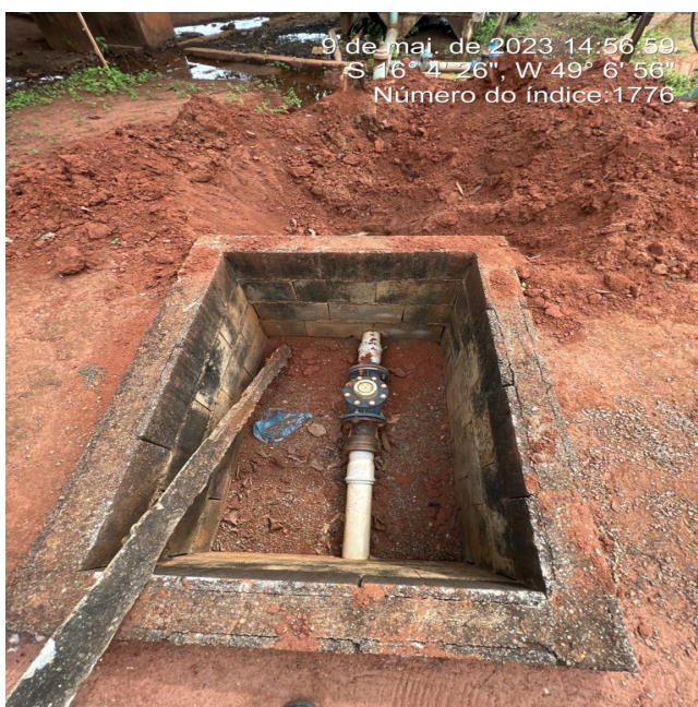
Foto 3 - Macromedidor com caixa de passagem sem tampa ou grade de proteção.