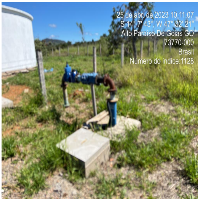
Foto 7 - Poço 03 com obras, cerca desmanchada.