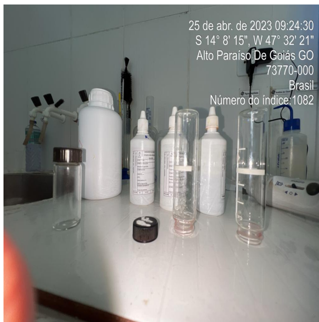
Foto 2 - Reagentes fora do prazo de validade.