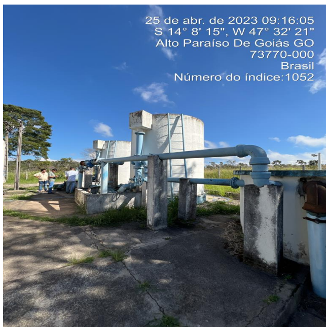
Foto 1 - Ausência de guarda-corpos na escada de acesso ao topo dos filtros