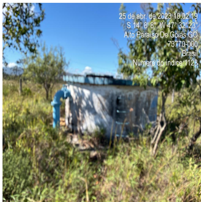
Foto 6 - RAP/Queda de pressão, zona rural com limpeza, organização e segurança inadequadas.