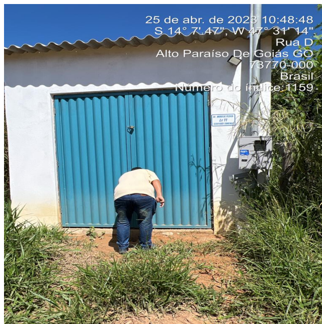
Foto 4 - EEAT/Booster Eldorado sem urbanização.