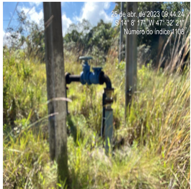
Foto 8 - Poço 01 sem urbanização.