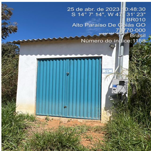
Foto 3 - EEAT/Booster Eldorado área com limpeza, organização e segurança inadequada.