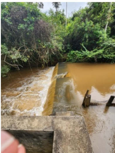
Foto 1 - Barragem da captação de água - Ribeirão Vai e Vem