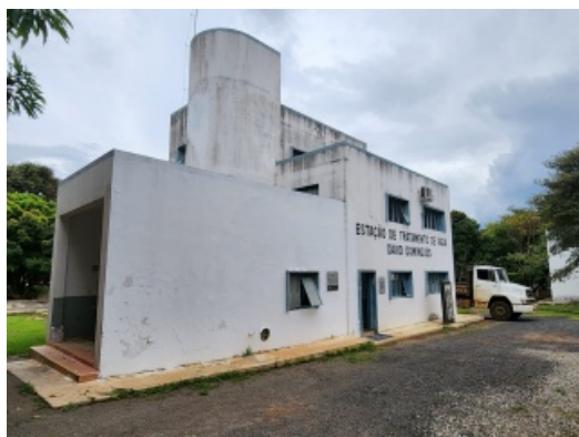
Foto 3 - Estação de Tratamento de Água - ETA