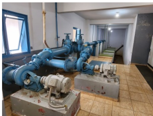
Foto 4 - Casa de Bombas - ETA