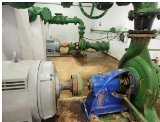
Foto 2 - Estação Elevatória de Água Bruta - EEAB