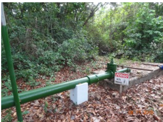
Foto 1 - Fios soltos e expostos retirados próximo à bomba da EEAB.