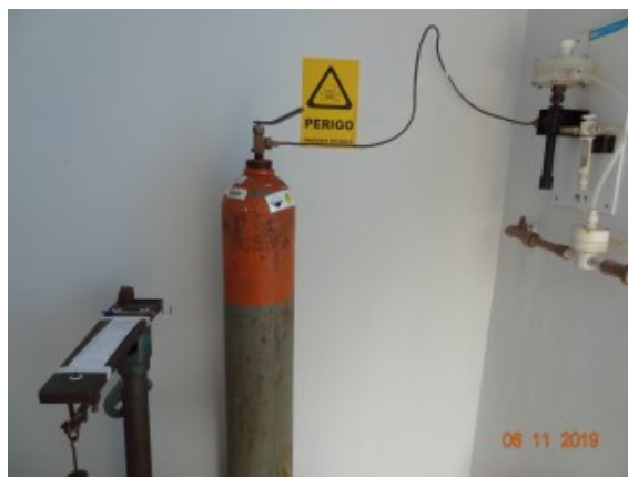
Foto 2 - Placa de advertência instalada.