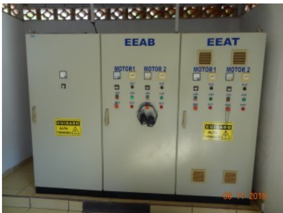
Foto 3 - Placa de advertência instalada.