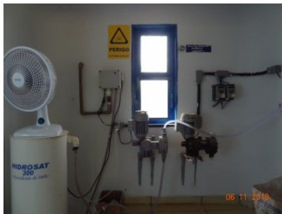
Foto 4 - Placa de advertência instalada.