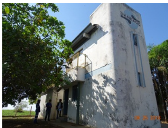
Foto 4 - Pintura desgastada na ETA.