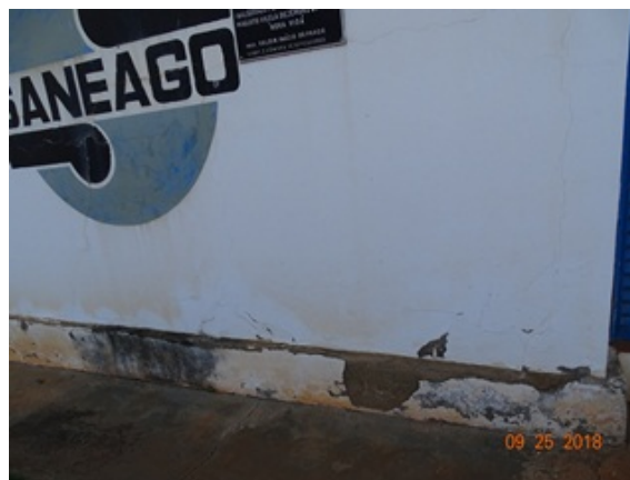
Foto 2 - Pintura desgastada.