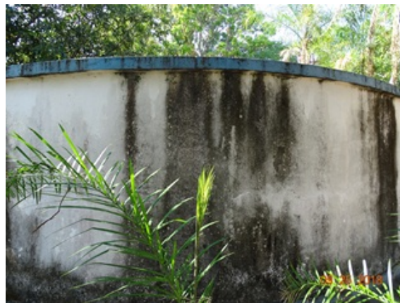
Foto 6 - Pintura desgastada RSE.