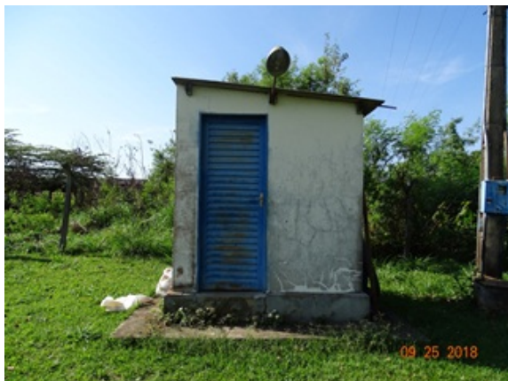
Foto 5 - Pintura desgastada EEAB.