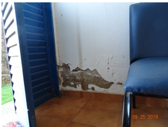
Foto 1 - Perda de revestimento argamassado.