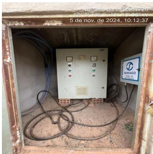
Foto 8 - Poço P8 com quadro de comando sem aviso de risco.