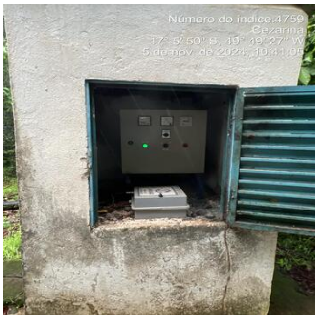
Foto 17 - Poço P7, abrigo do quadro de comando com pintura desgastada.