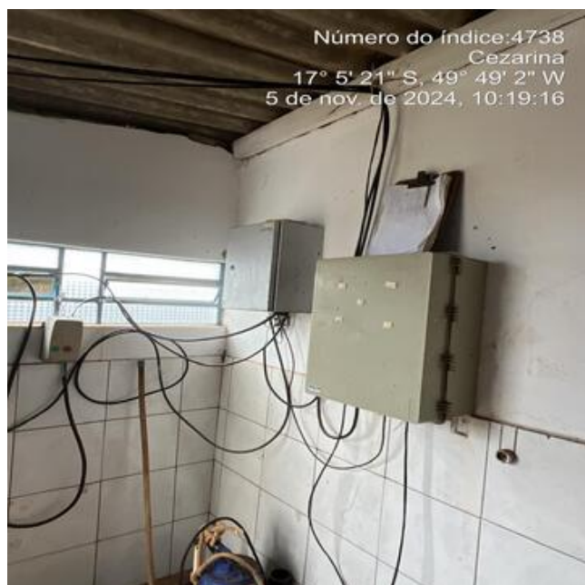
Foto 5 - C.R. Linda Vista casa de química, quadro de comando sem aviso de risco.