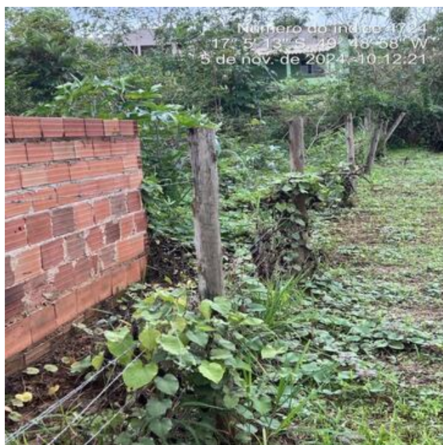
Foto 11 - Poço P8 com cerca de proteção danificada.