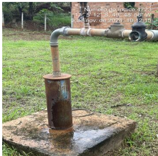
Foto 4 - Poço P8 sem placa de identificação.