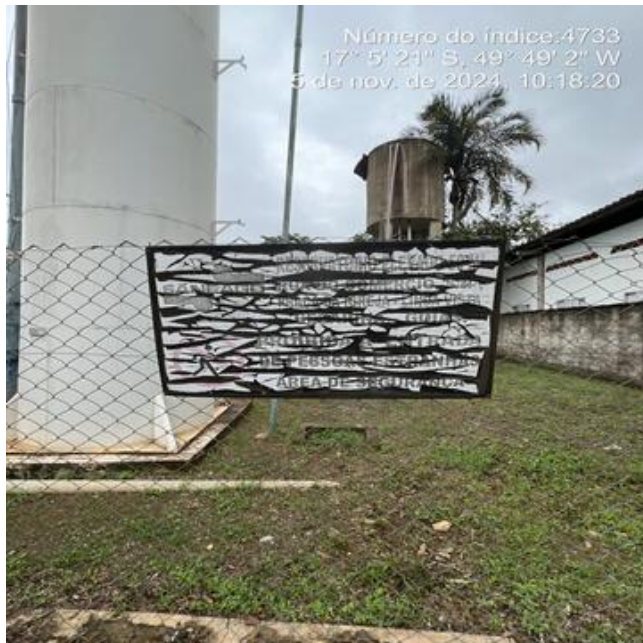
Foto 1 - C.R. Linda Vista com placa de identificação danificada.