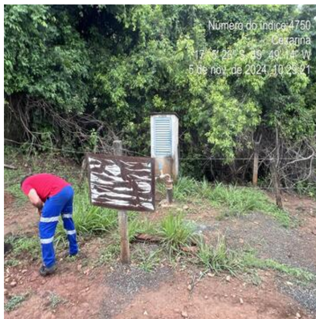
Foto 16 - Poço P1, abrigo do quadro de comando com pintura desgastada.