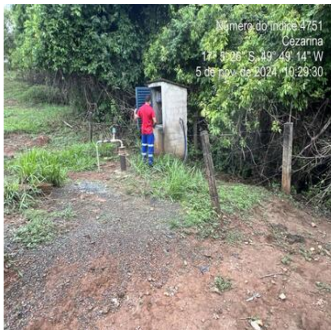
Foto 9 - Poço P1 com cerca de proteção danificada.