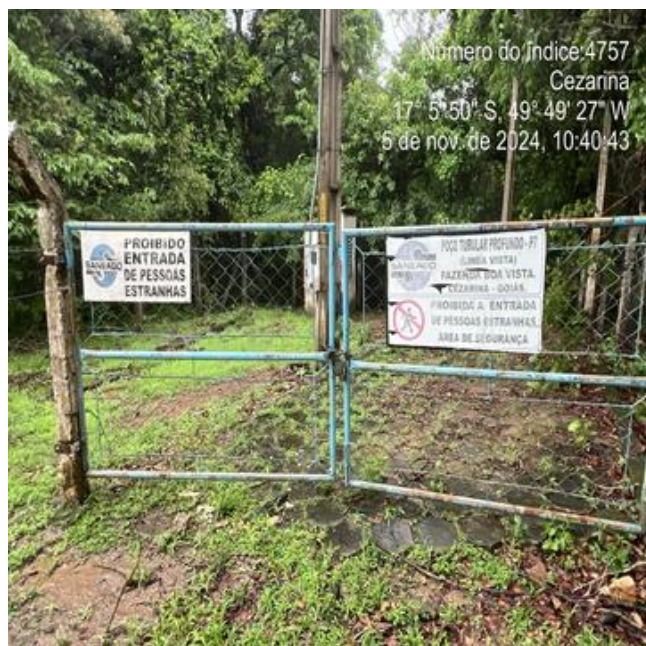
Foto 7 - Poço P7 com quadro de comando sem aviso de risco.