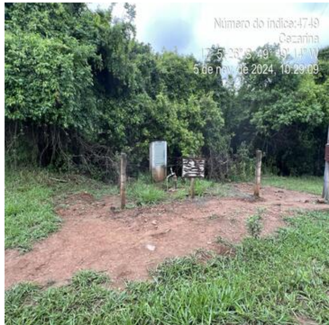
Foto 2 - Poço P1 com placa de identificação danificada.