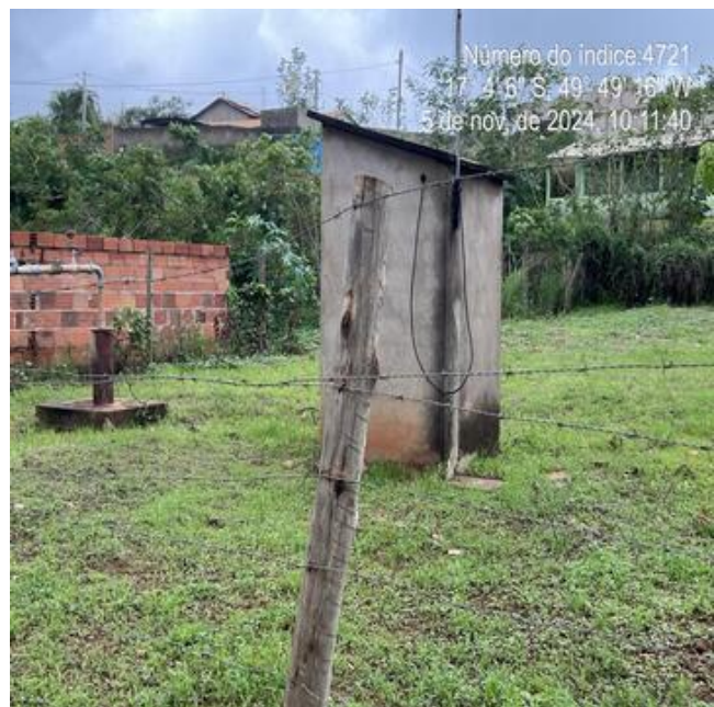
Foto 18 - Poço P8, abrigo do quadro de comando com pintura desgastada.