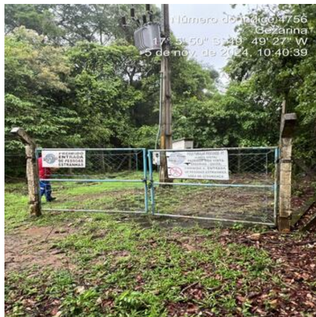
Foto 10 - Poço P7 com cerca de proteção danificada.