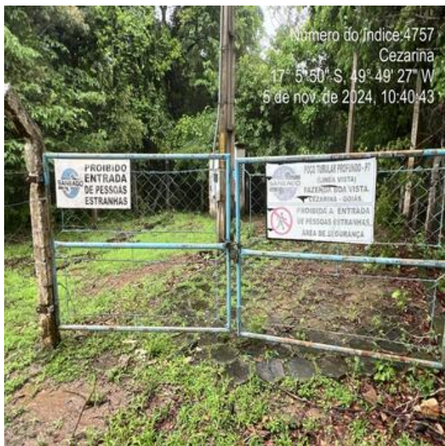
Foto 3 - Poço P7 com placa de identificação danificada.