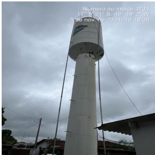
Foto 19 - C.R. Linda Vista, REL/50 m 3 metálico com corrosão.