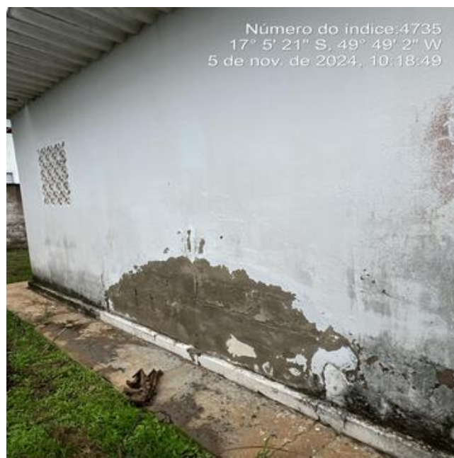
Foto 12 - C.R. Linda Vista, casa de química com perda de revestimento.