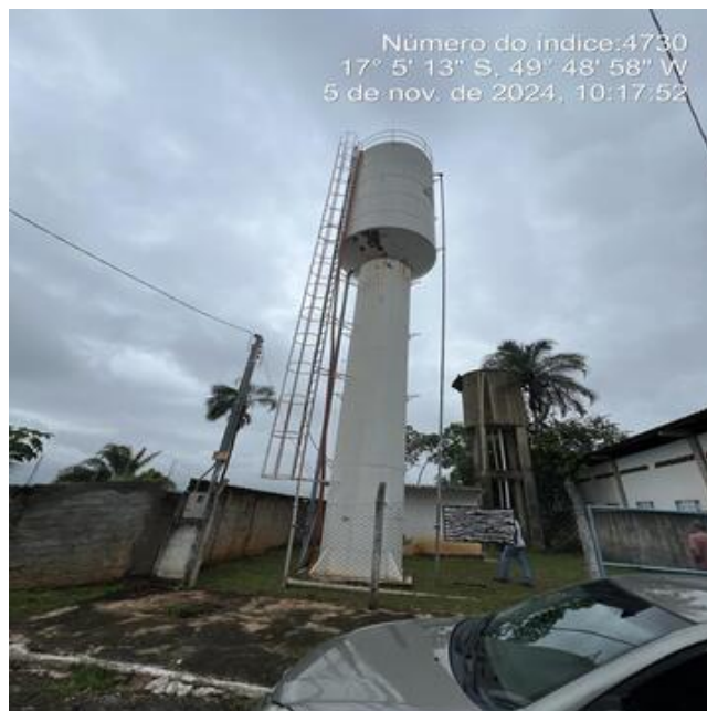
Foto 14 - C.R. Linda Vista REL/50 m 3 metálico com pintura desgastada.