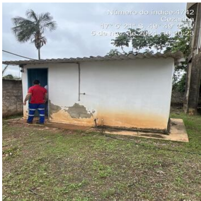
Foto 13 - C.R. Linda Vista, casa de química com perda de revestimento.