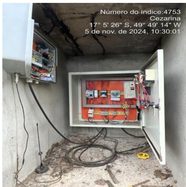
Foto 6 - Poço P1 com quadro de comando sem aviso de risco.