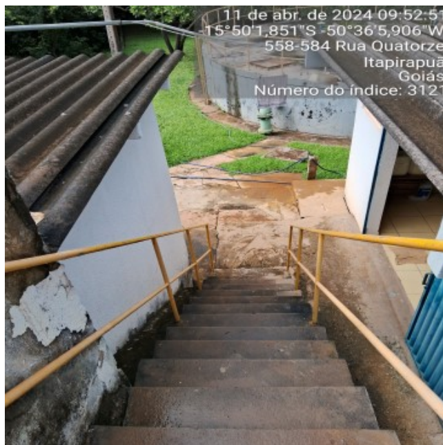
Foto 12 - Edificações da ETA com pintura desgastada.