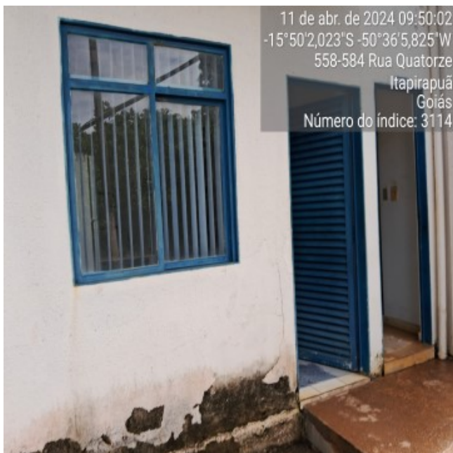
Foto 11 - Edificações da ETA com pintura desgastada.