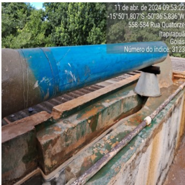
Foto 13 - Calha Parshal da ETA com pintura desgastada.