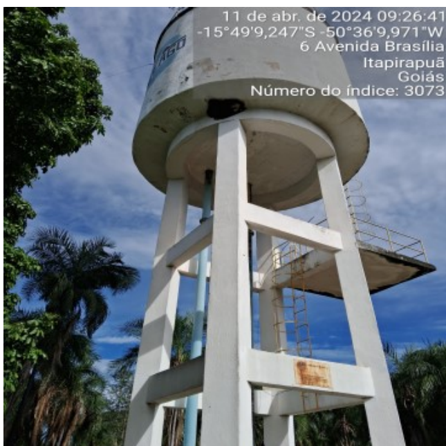
Foto 9 - REL/Distrito com pintura desgastada.