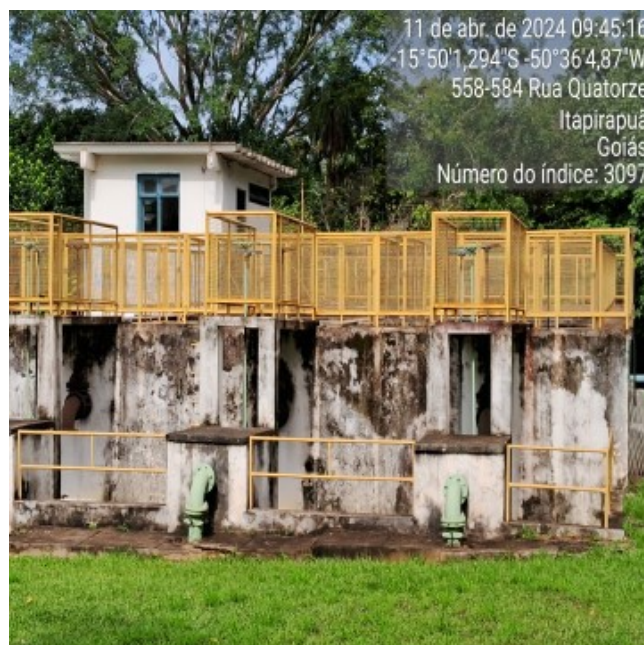
Foto 10 - Edificações da ETA com pintura desgastada.