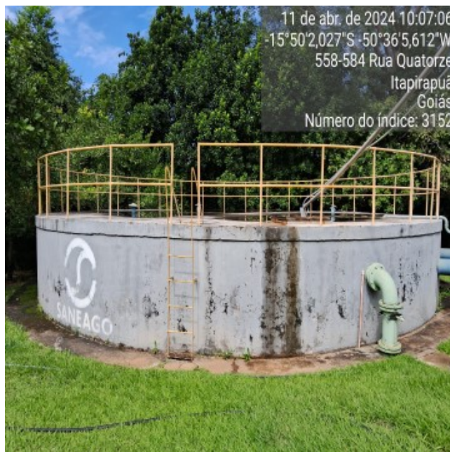
Foto 14 - RAP da ETA com pintura desgastada.