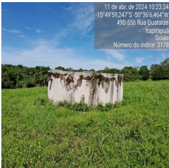
Foto 7 - RAP/ETA com pintura desgastada - lavagem de filtros.