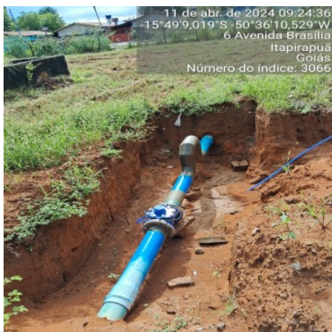
Foto 1 - REL/Escritório com escavação não finalizada.