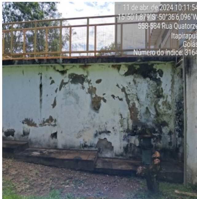
Foto 15 - Flocladores e Filtração parte lateral com pintura desgastada.