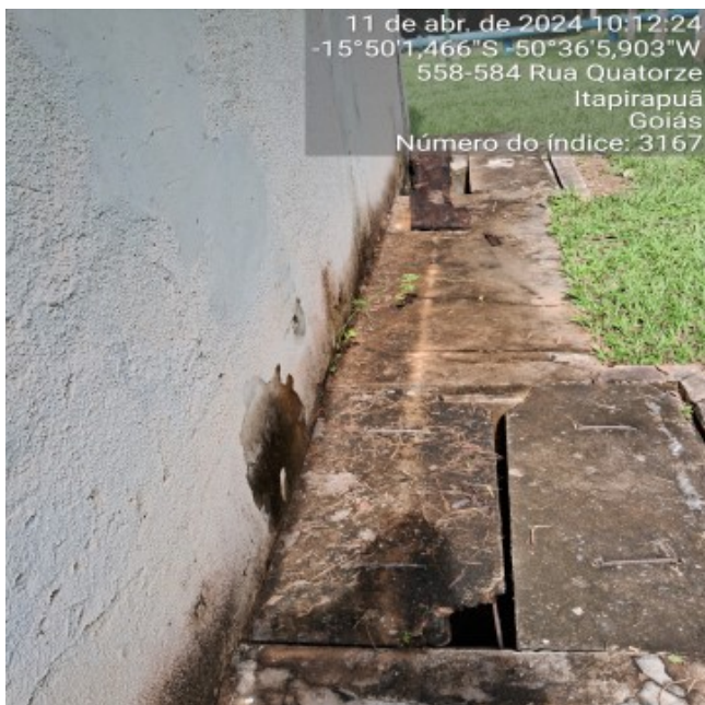
Foto 5 - Caixas de passagem com tampa danificada na área da ETA.