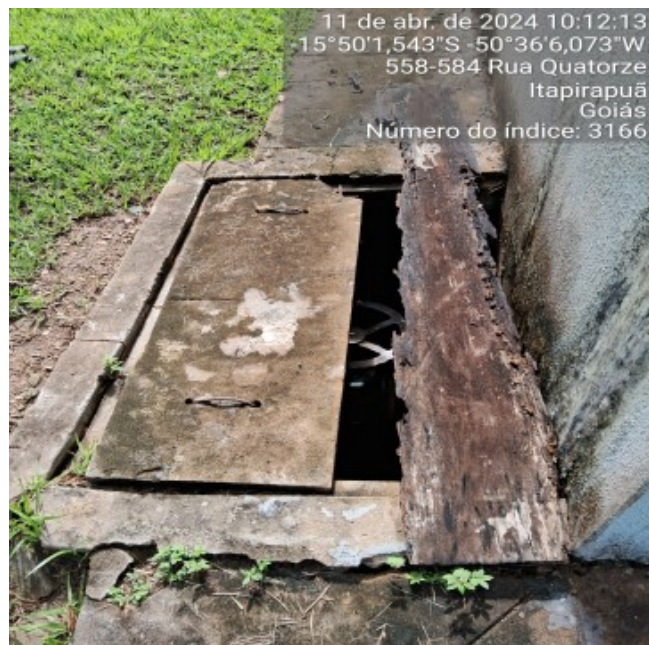
Foto 4 - Caixas de passagem sem grade de proteção na ETA.