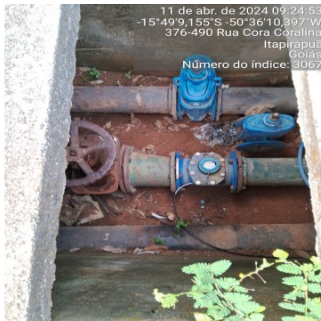
Foto 8 - Caixa de passagem do macro medidor do REL/Escritório sem tampa ou grade de proteção.