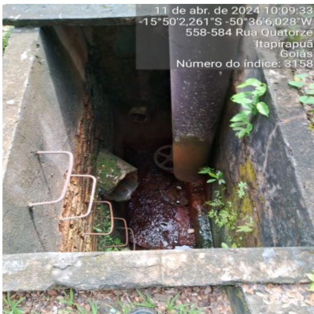
Foto 3 - Caixas de passagem sem grade de proteção na ETA.