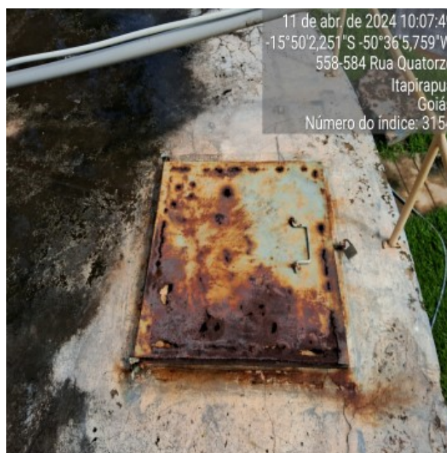
Foto 2 - RAP/ETA com tampa de inspeção danificada.