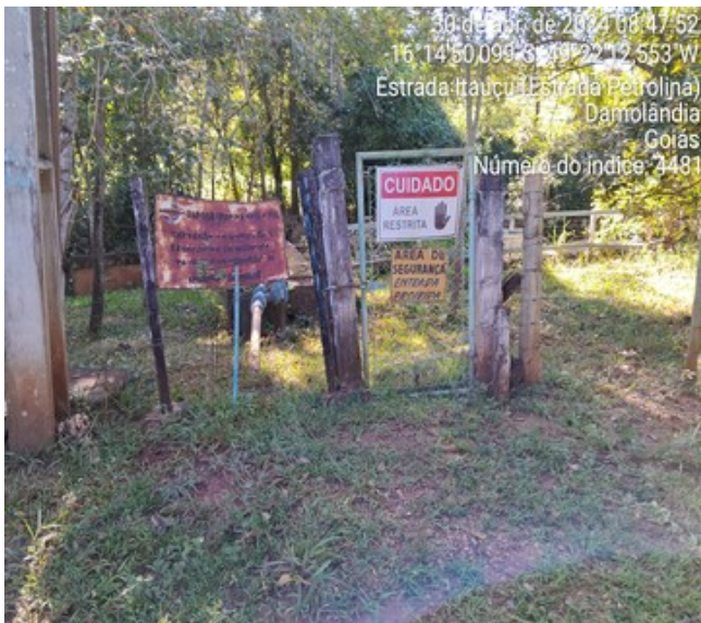
Foto 1 - Cerca de proteção da área da captação danificada.