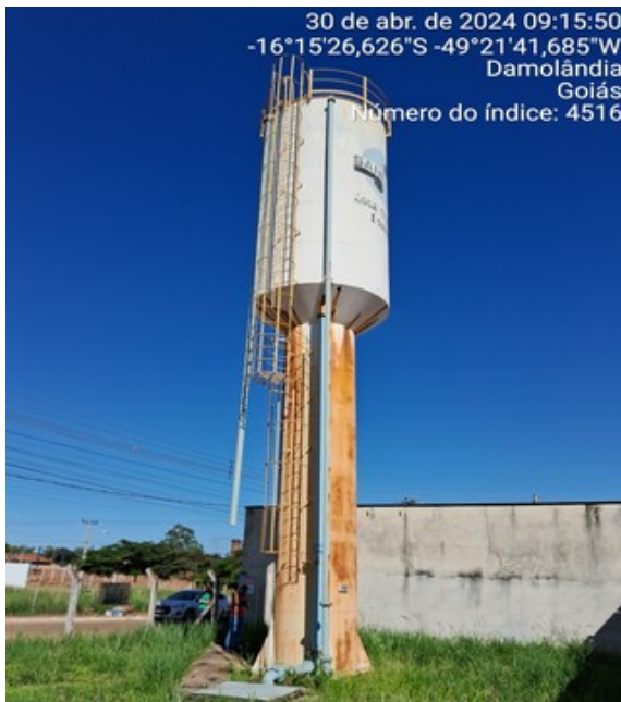
Foto 6 - Pintura desgastada do REL Jardim Esperança II.