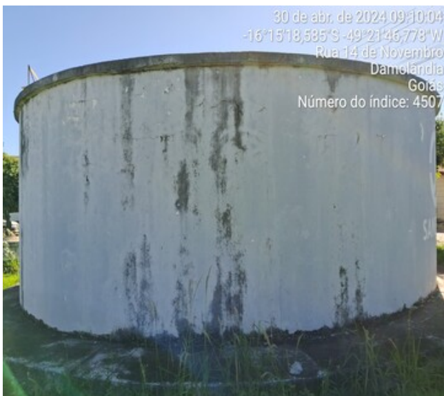
Foto 3 - Presença de trincas, infiltrações e eflorescências no RAP Jardim Esperança I.