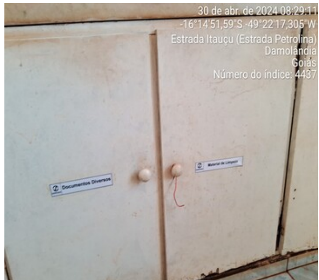
Foto 2 - Armários laboratório ETA deteriorados.