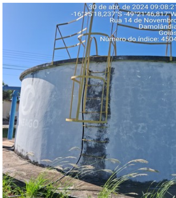
Foto 5 - Pintura desgastada do RAP Jardim Esperança I.