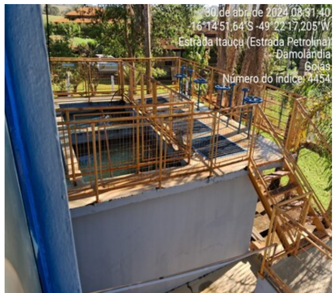
Foto 4 - Pintura desgastada dos guarda-corpos dos floculadores, decantadores e filtros.