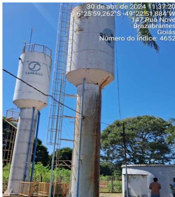
Foto 6 - REL 1 e REL 2 do CR Esplanada, com pintura desgastada.