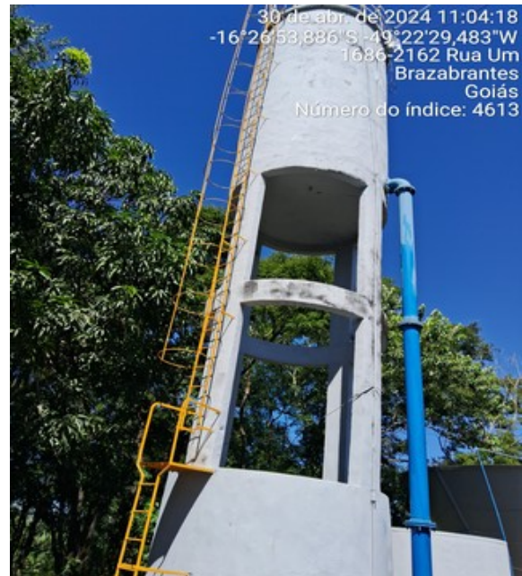
Foto 4 - REL Lavagem de filtros ETA, com pintura desgastada.