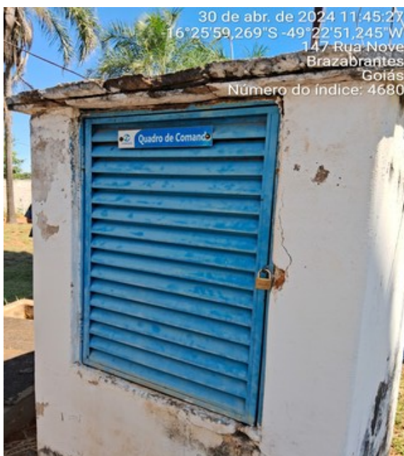
Foto 7 - Abrigo do Quadro de Comando da EEAT Esplanada, com perda de revestimento e ferragem exposta.