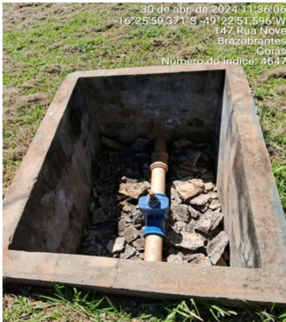
Foto 3 - Caixas de passagem sem tampa ou grade de proteção adequada na área da EEAT/CR Esplanada.