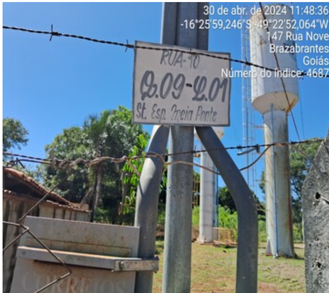
Foto 1 - EEAT/CR Esplanada sem identificação.