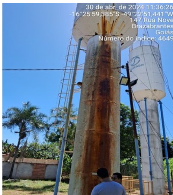
Foto 8 - REL 1 CR Esplanada, com corrosão na base.