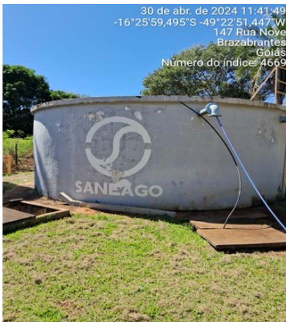
Foto 5 - RAP CR Esplanada, com pintura desgastada.