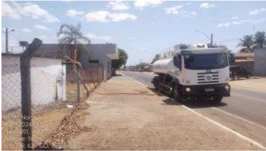
Foto 3- Abastecimento dos reservatórios por intermédio de caminhão pipa.