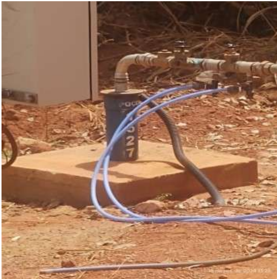
Foto 1 - Poço 1527 perfurado e interligado ao sistema.