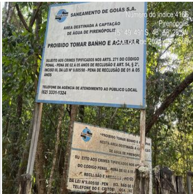
Foto 9 - Captação de água bruta na nascente do Córrego do Frota.