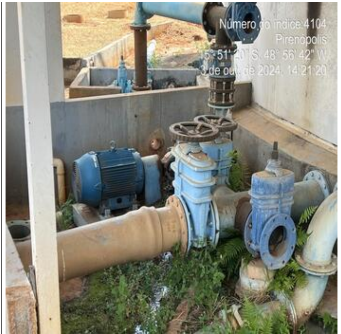
Foto 6 - ETA/EEAT Santa Bárbara com bombas substituídas de maior potência.