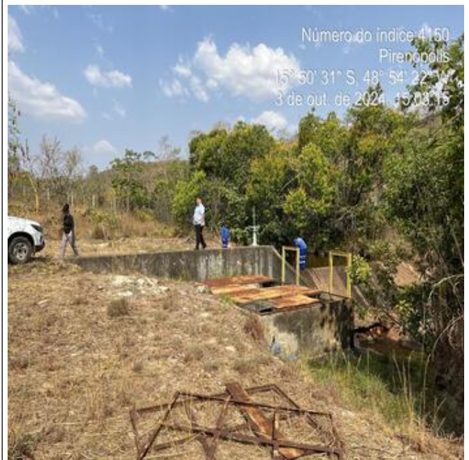
Foto 8 - Captação de água bruta no Córrego Barriguda (Andorinha).