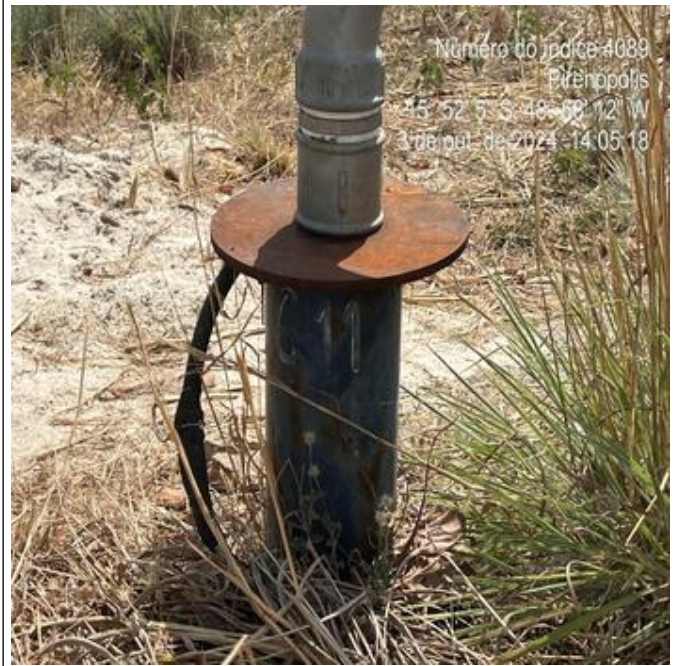
Foto 2 - Poço 611 interligado ao SAA, está de reserva.