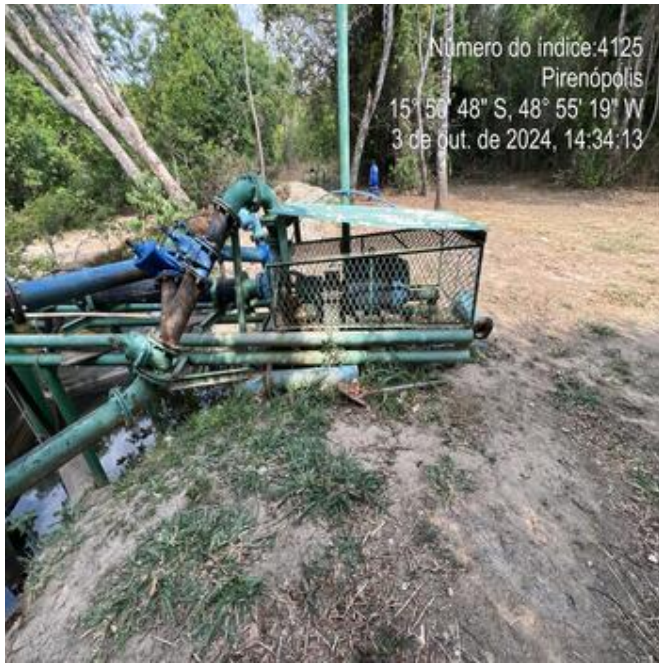
Foto 5 - Conjunto de motobomba de eixo horizontal instalado.