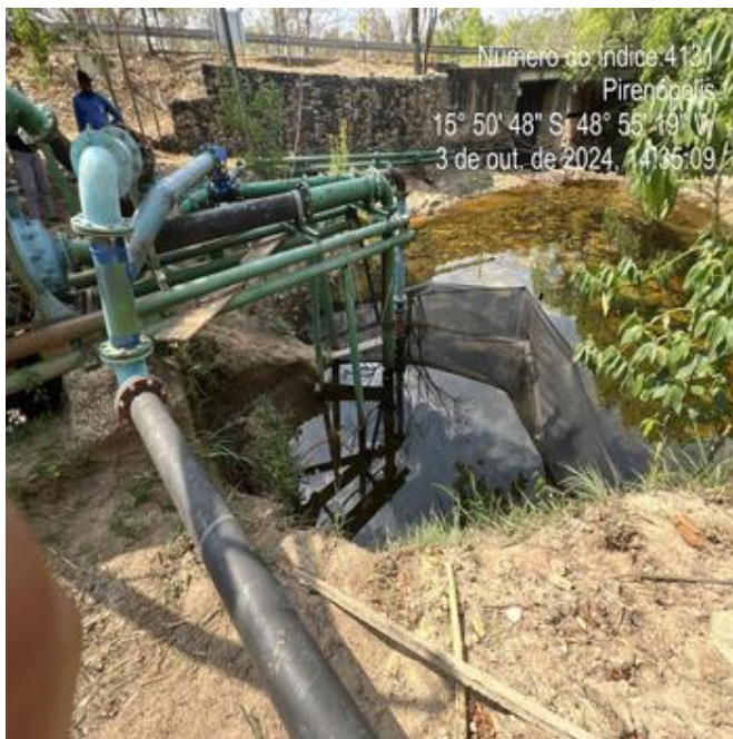
Foto 7 - Captação de água bruta Rio das Almas.