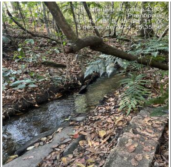
Foto 10 - Captação de água bruta na nascente do Córrego do Frota.