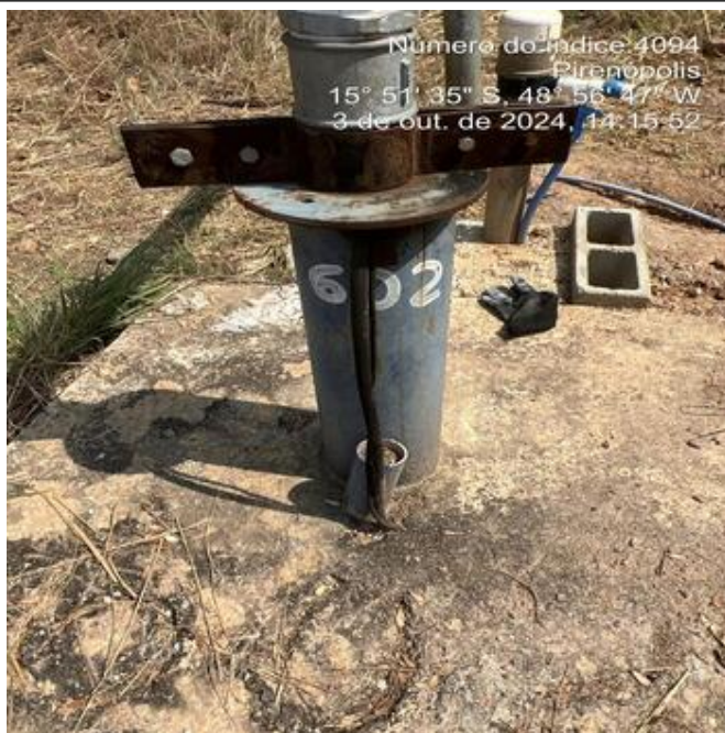
Foto 3 - Poço 602 interligado ao SAA, em operação.