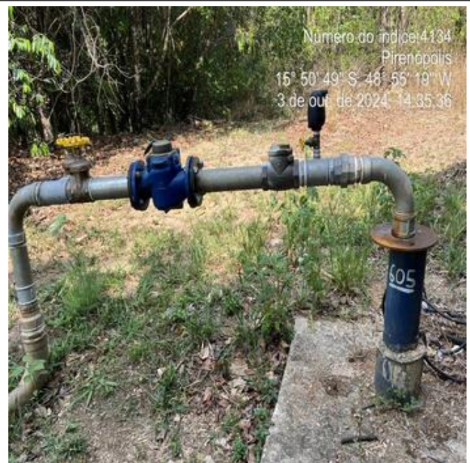
Foto 4 - Poço 605 interligado ao SAA, em operação.