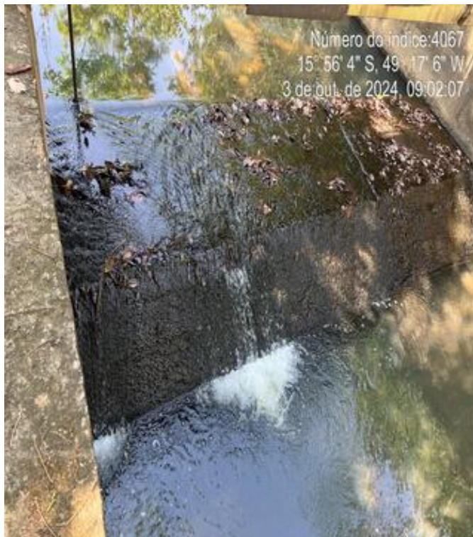
FOTO 3 - Captação no Córrego dos Alves com água vertendo a jusante.