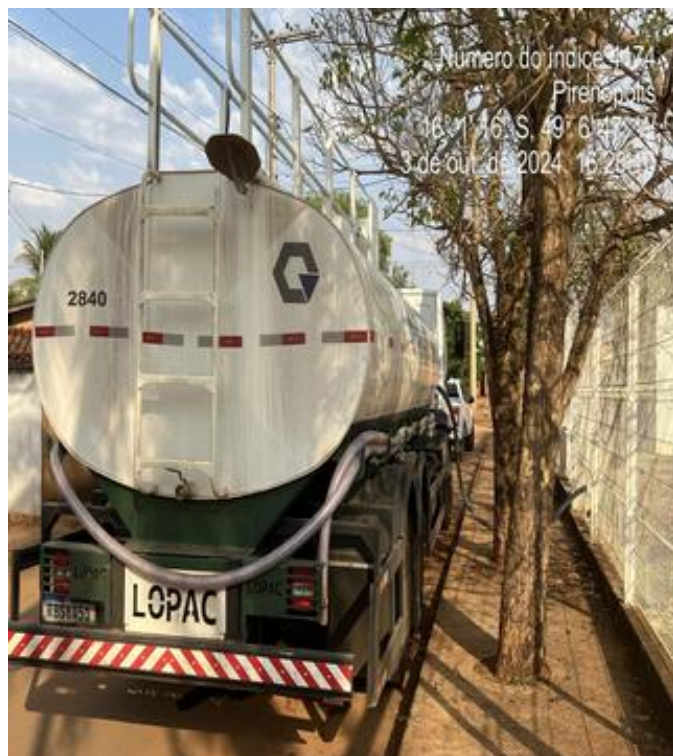
Foto 02 - Caminhão pipa abastecendo reservatório do distrito.