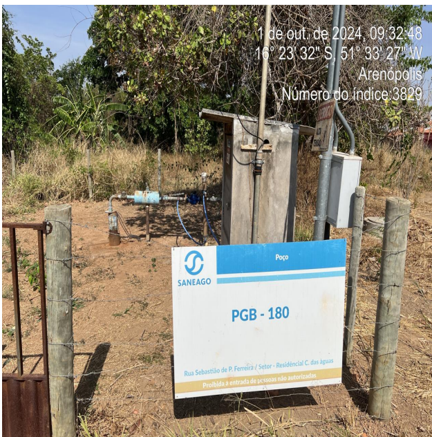
Foto 03 - PGB 180 interligado.