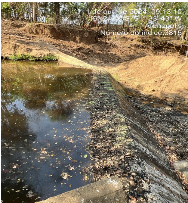
Foto 01 - Captação/Córrego Lajeado não está vertendo.