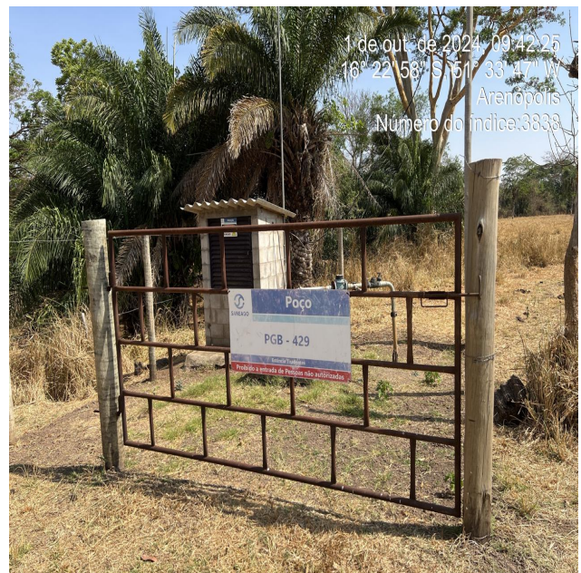
Foto 04 - PGB 429 interligado.