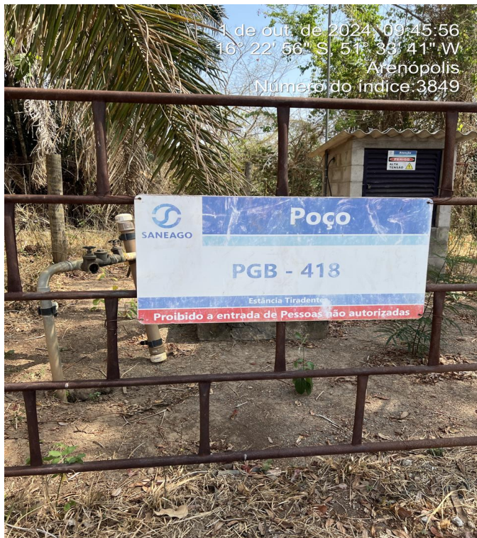
Foto 05 - PGB 418 interligado.