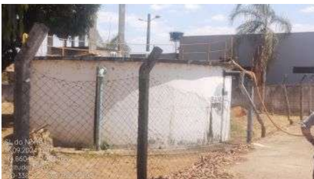
Foto 5 - Reservatório apoiado no Distrito.