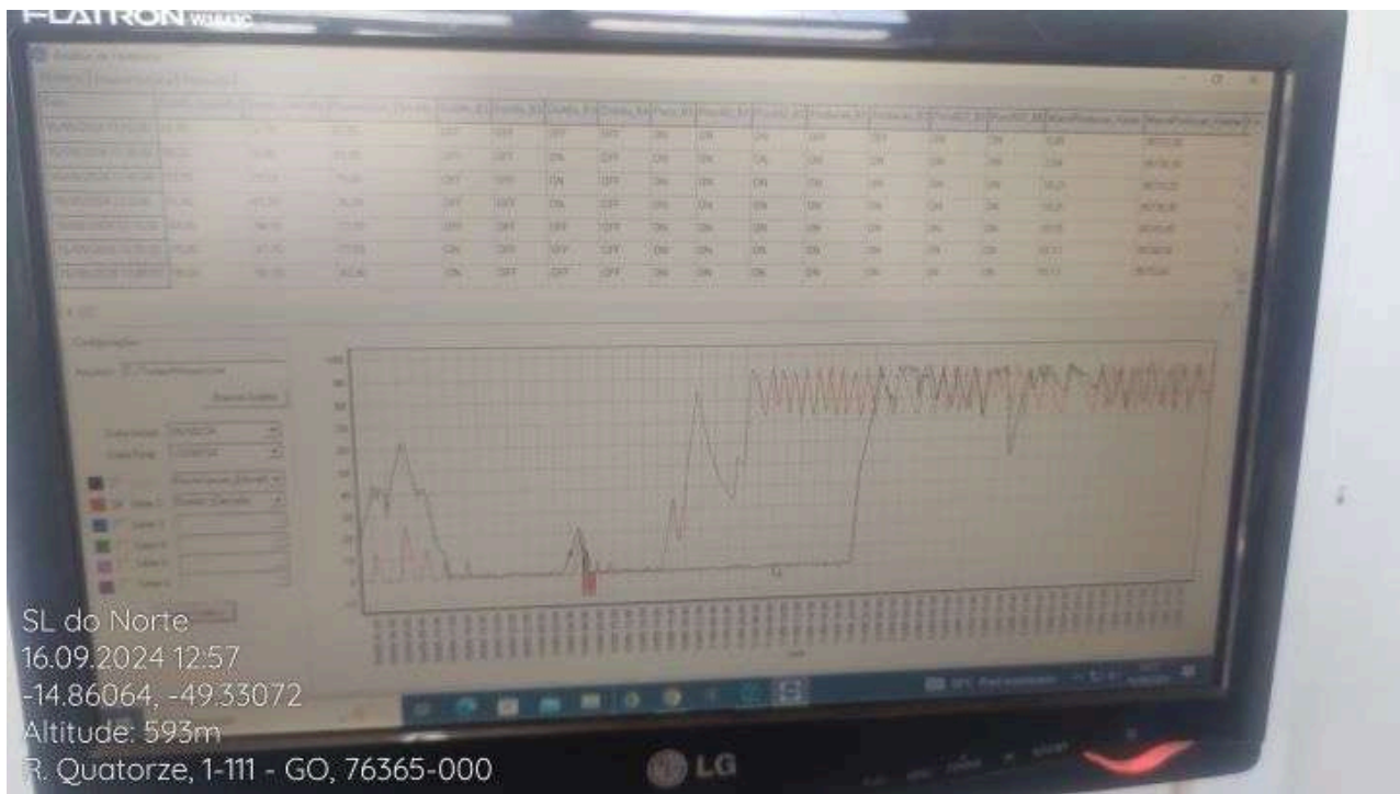
Foto 7 - Gráfico de nível dos reservatórios elevados.