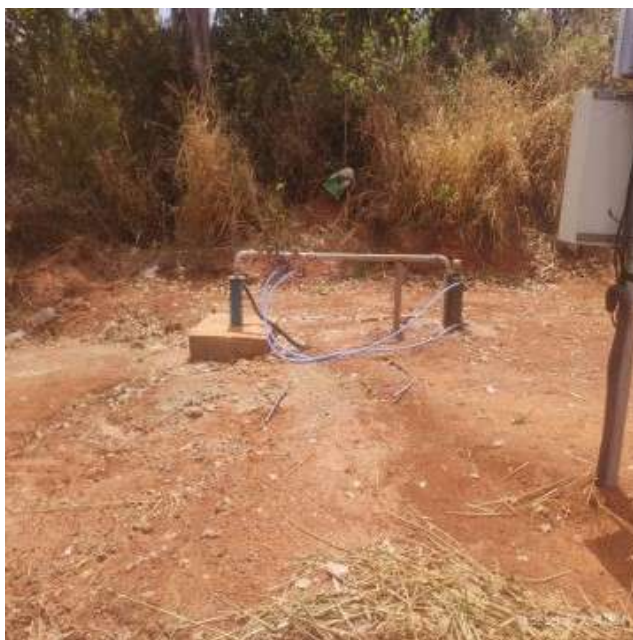
Foto 9 - Poço P 1527.