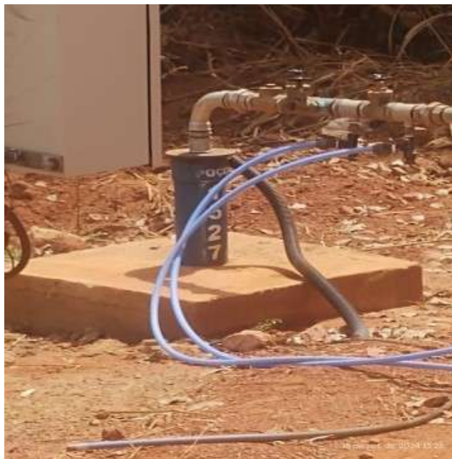
Foto 8 - Poço recente perfurado P 1527.