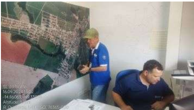
Foto 3 - Entrevista com o Gerente do Distrito.