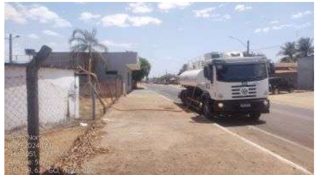
Foto 2 - Caminhão-pipa abastecendo o RAP do distrito.