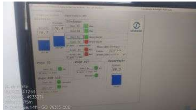
Foto 4 - Imagem do supervisório às 12h53min.