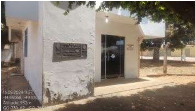
Foto 1 - Distrito de São Luiz do Norte.