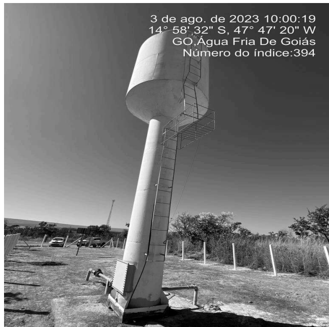
Foto 2 - Ausência de guarda-corpos na escada superior e inferior do reservatório.