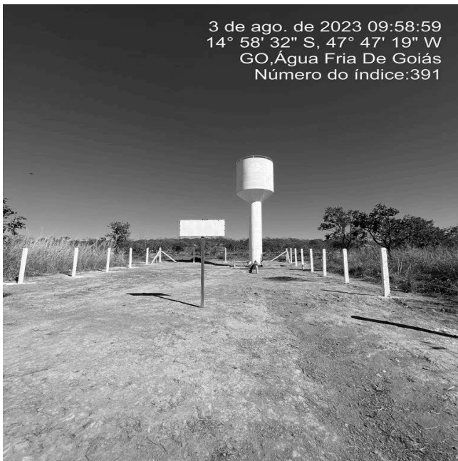
Foto 1 - Placa de identificação do REL deteriorada.