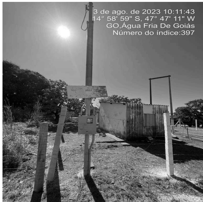
Foto 4 - Placa de identificação deteriorada.