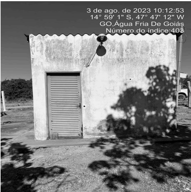
Foto 5 - Perda de revestimento e pintura desgastada da casa de química.