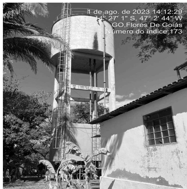
Foto 2 - Casa de química do poço com pintura desgastada.