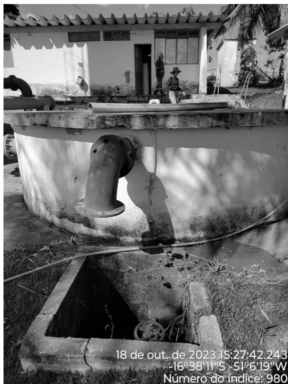
Foto 1 - Caixa de passagem sem tampa ou grade de proteção adequada na área da ETA.