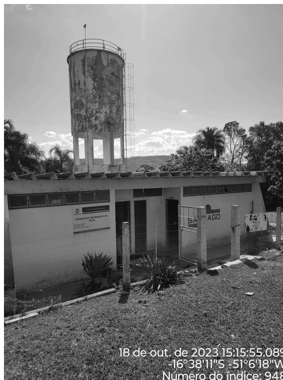
Foto 6 - Edificações da ETA com pintura desgastada.