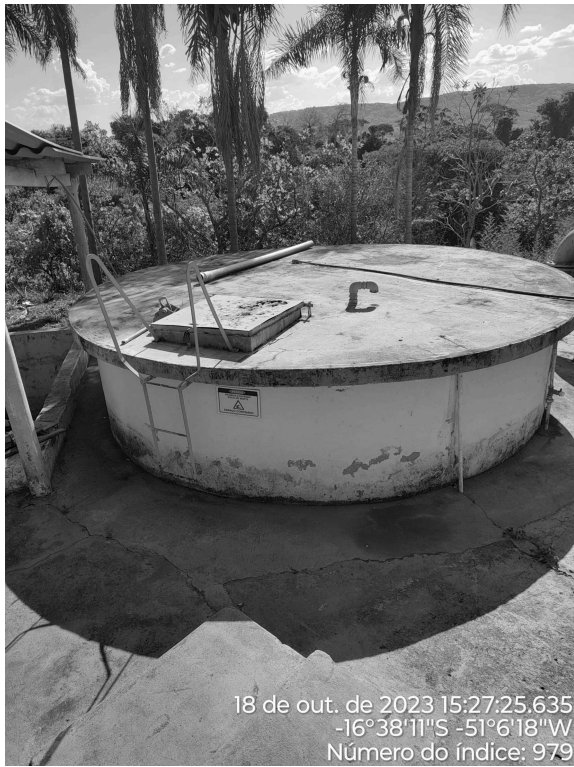
Foto 9 - Reservatório semi-enterrado ETA (poço de contato) com pintura desgastada e corrosão na tampa de inspeção.