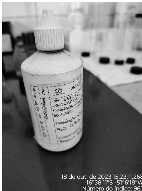
Foto 4 - Reagente vencido.