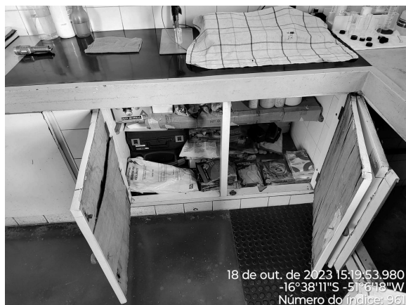
Foto 5 - Armários com portas danificadas.