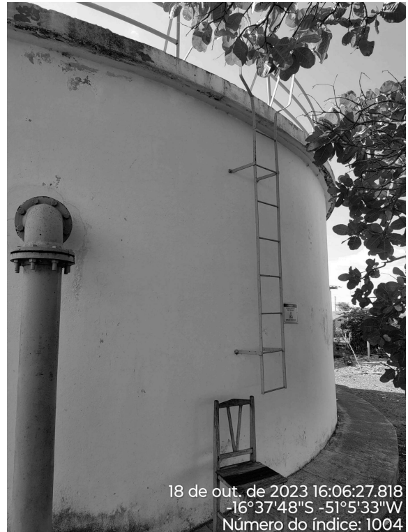
Foto 12 - Ausência de guarda-corpos no RAP Vila União (escritório).