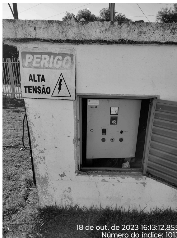
Foto 8 - Abrigo do quadro de comando do Booster do distrito com pintura desgastada.