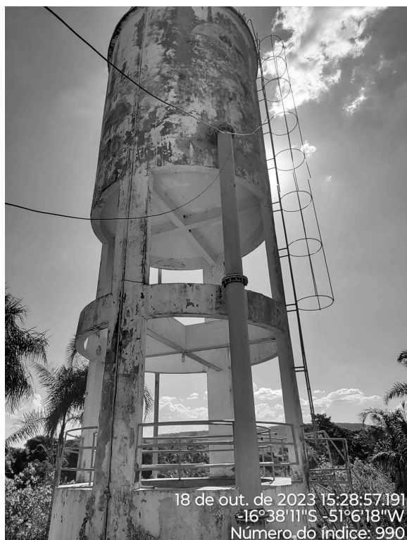
Foto 7 - Filtro russo e REL lavagem de filtros (ETA) com pintura desgastada