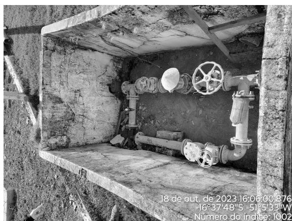
Foto 3 - Caixa de passagem do macromedidor RAP Vila União (escritório) sem tampa ou grade de proteção.