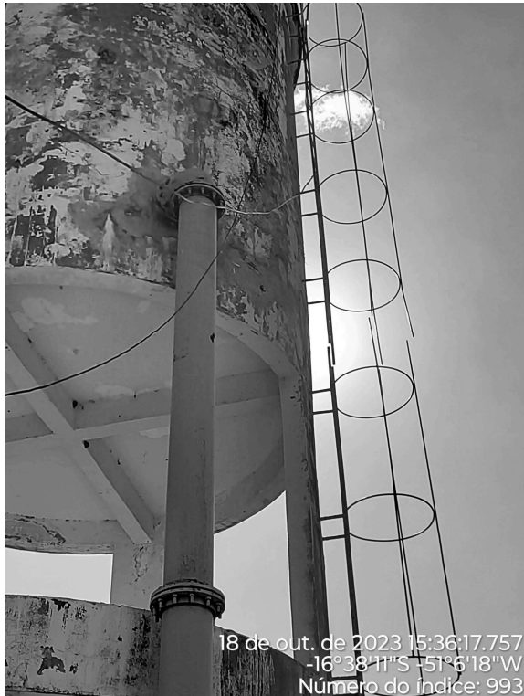
Foto 11 - Guarda-corpos no REL lavagem de filtros (ETA) danificado.