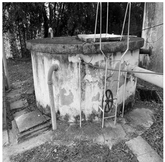
Foto 8 - RAP/ETA com presença de trincas, infiltrações, eflorescências e pintura desgastada.