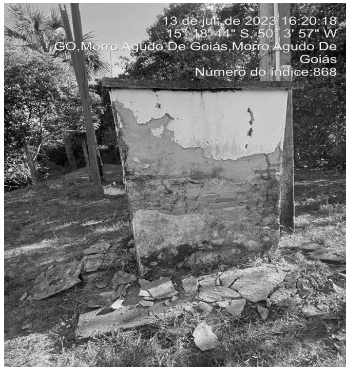
Foto 9 - Abrigo com perda de revestimento e cerca da área urbanizada danificada.