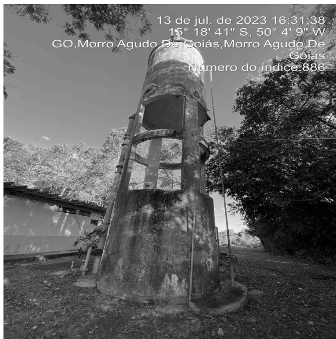
Foto 2 - Edificações da ETA com pintura danificada e perda de revestimento.