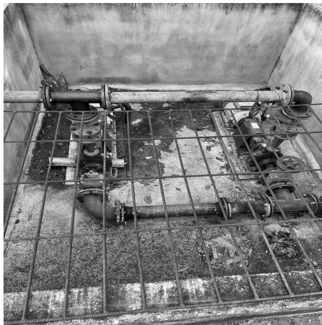
Foto 4 - Caixas de passagem sem tampa ou grade de proteção.