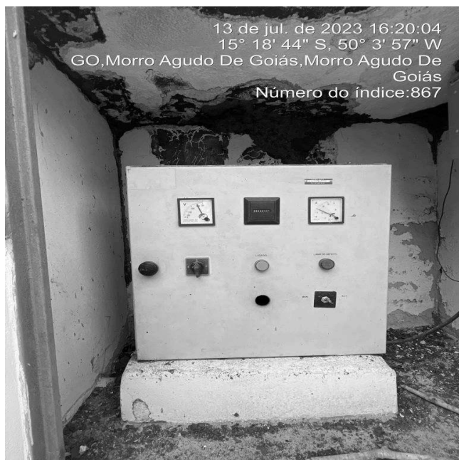
Foto 3 - EEAT/ETA Q.C. sem aviso de risco.