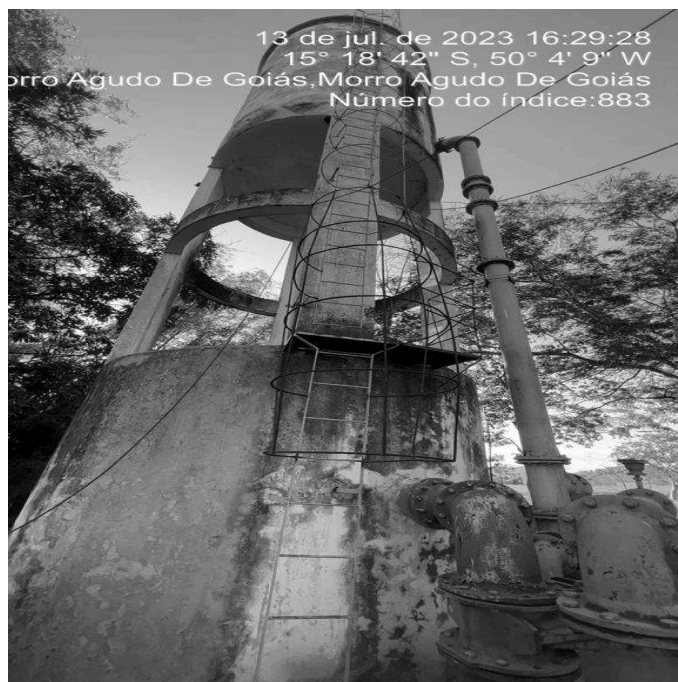
Foto 7 - REL/ETA com presença de trincas, infiltrações, eflorescências e pintura desgastada.